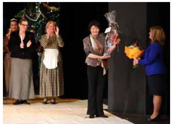
A képek rendelhetőek a www.kovesszilviafoto.com oldalon