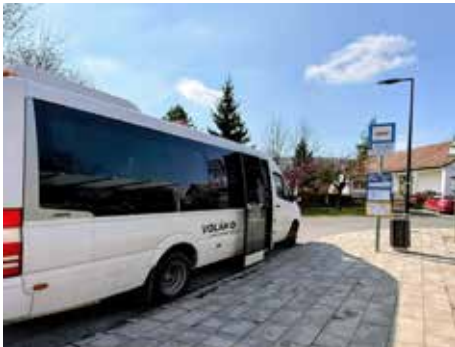
797 Budakeszi – Budapest – Remeteszőlős – Nagykovácsi