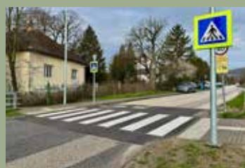
ÚJABB GYALOG- ÁTKELŐHELY