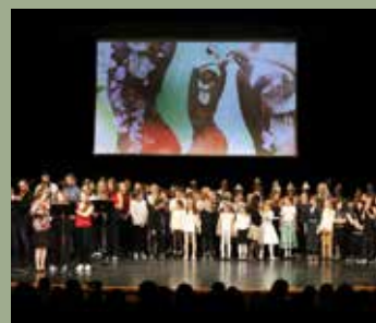
30 ÉVES A NAMI