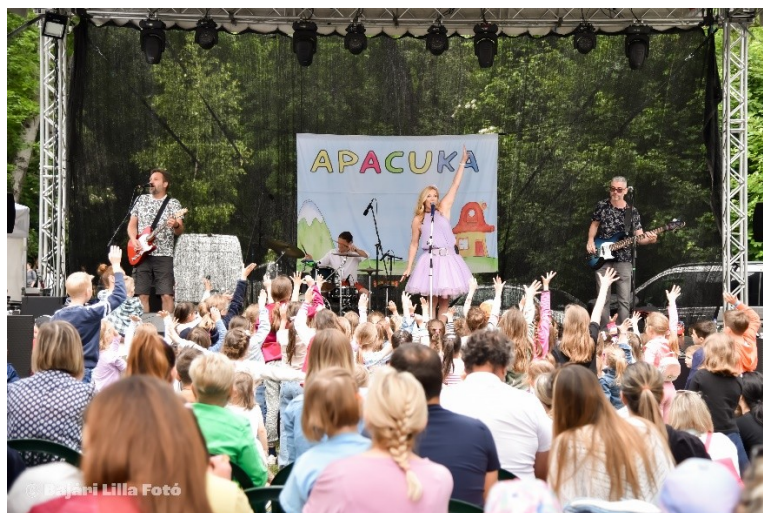
Apacuka koncert – 2023. 06. 04.