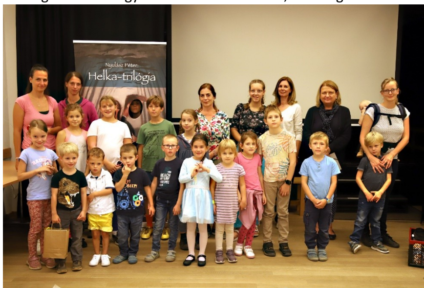
A 2023.év Könyvfaló-díjasainak csoportképe