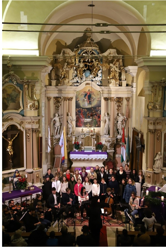
Adventi koncert – 2023. 12. 17.