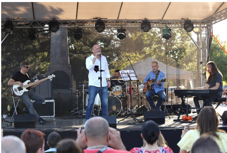
HobbyStars koncert – 2023. 08. 12.

A színpadi eseményeket 2023-ban is kézműves kirakodóvásár kísérte, és természetesen nem hiányozhatott a vattacukor, lángos, kürtőskalács, popcorn stb. sem a vendéglátósok kínálatából. Az elmúlt időszakban remek együttműködések kezdődtek a helyi vállalkozókkal,