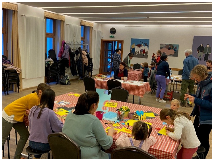
Brumm és zümm! Beporzók napi finisszázz a Mackókiállításban – 2023. 03. 09.