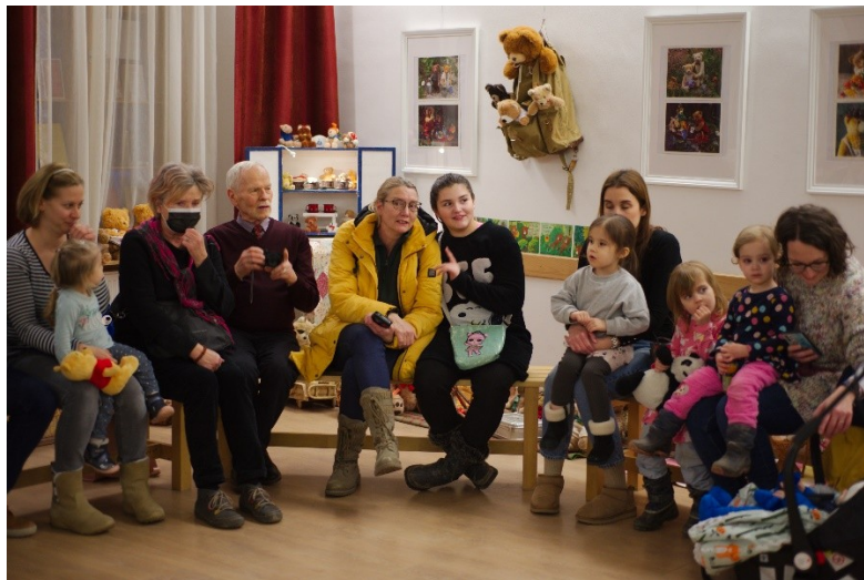
Mackótulajdonosok a Mackókiállításon – kiállításmegnyitó az Öregiskolában, 2023. 02. 04.

Nagyon nagy sikere volt a Mackókiállítás névre keresztelt közösségi kiállításnak, amelynek az volt az egyik nagy újdonsága, hogy a látogatók által behozott plüssmackók képezték a tárlat törzanyagát. A koncepciót pedig a felajánlások alapján az Öregiskola kreatív munkatársai állították össze. Ki gondolta volna, hogy a muzeális értékű mackóktól kezdve, a külföldről származó teddy macikon át a rendszerváltás utáni plüsstermékekig ennyi féle-fajta mackó rejtőzik Nagykovácsi házaiban!