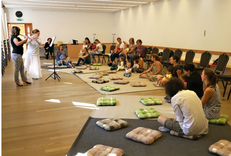
Babakoncert - 2023. 09. 18.