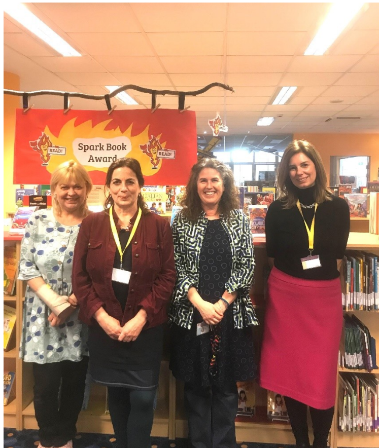
Látogatás az Amerikai Nemzetközi Iskolában

-Március 10-én szakmai látogatásra mentünk az Amerikai Nemzetközi Iskolába, ahol az ottani könyvtáros kollégák bemutatták az alsós és felsős iskolai könyvárat, és szakmai beszélgetésen vettünk részt az ottani dolgozókkal.