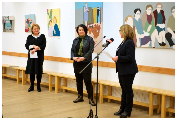
Hazai vizeken - kiállításmegnyitó az Öregiskolában, 2023. 01. 20.