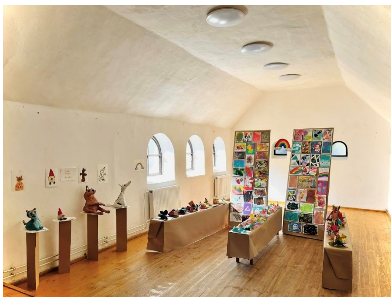
Házi kiállítás a Faluházban a Firka tábor zárásaként – 2023. nyara