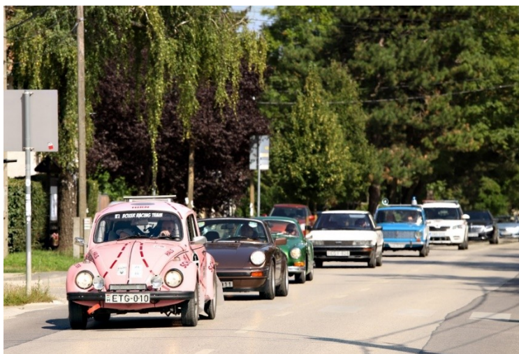
Veterán autók felvonulása a Kossuth Lajos utcán – 2023. 08. 12.

Változatos programokat igyekeztünk összeállítani erre a nyárvégi, az időjárás viszontagságainak, és a rendelkezésre álló hely szűkösségének kitett szabadtéri rendezvényre is. A Varázskastélyhoz hasonlóan ez alkalommal is számíthattunk a helyi közreműködőkkel-fellépőkkel való együttműködésre, és például a veterán járművek felvonulását is civil előkészítés előzte meg. Nagy örömmel fogadjuk az ilyen kezdeményezéseket, hiszen ezek által válik egy közösségi esemény egyre szélesebb rétegek ünnepévé.