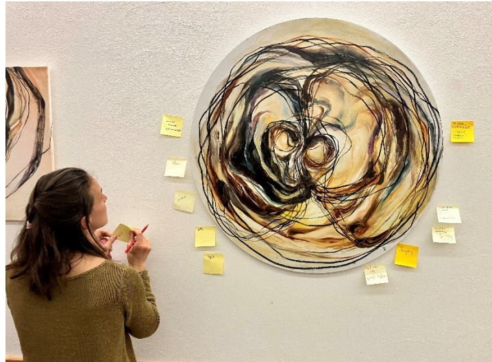
Új képek – kiállításmegnyitó az Öregiskolában, 2023. 04. 14.