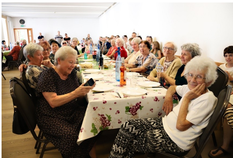
Vendéglátás az idősek világnapján – 2023. 09. 29.

Szeptember 29. Idősek világnapja: vendéglátással egybekötött zenés-műsoros délután Nagykovácsi szépkorú lakosai számára a Tiszta Forrás Nyugdíjasklub tagjai és a Nagykovácsi Kispatak Óvoda közreműködésével