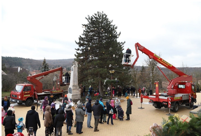
Közösségi fadíszítés – 2023. 12. 03.

Advent első hétvégéjén a szokásos mintegy 100 család részvételével még feldíszítettük a falu karácsonyfáját, a második vasárnapon viszont csak beltéri programot tudtunk kínálni.