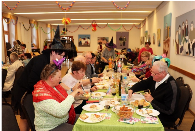
Nyugdíjas farsang – 2023. 02. 16.

Február 16. Itt a farsang, áll a bál! Farsangi mulatság a Tiszta Forrás Nyugdíjas Klub szervezésében