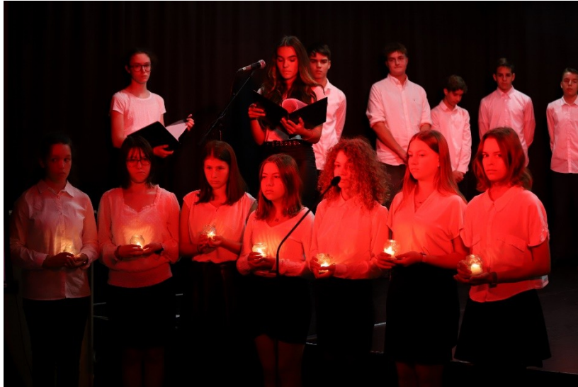
Október 6.

Október 23-án az 1956-os forradalom és szabadságharc napján újra a Nagykovácsi Általános Iskola falai között emlékezhetünk, a 6. évfolyam diákjainak ünnepi műsorával.