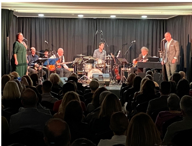
Teltházas előadás a magyar költészet napján – 2023. 04. 11.

Szeptember 29. Idősek világnapja: vendéglátással egybekötött zenés-műsoros délután Nagykovácsi szépkorú lakosai számára a Tiszta Forrás Nyugdíjasklub tagjai és a Nagykovácsi Kispatak Óvoda közreműködésével