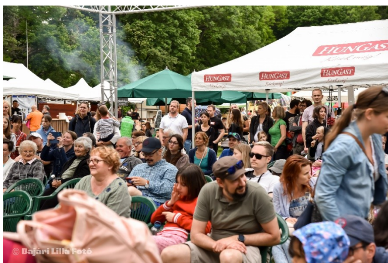
A Parázs koncert közönsége – 2023. 06. 04.