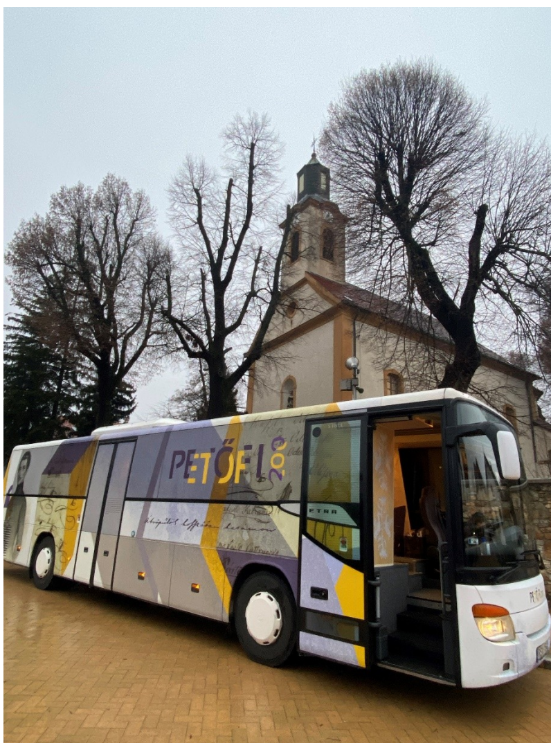
A Petőfi-busz Nagykovácsiban

-Január 19-én a Petőfi-buszt fogadta Nagykovácsi.