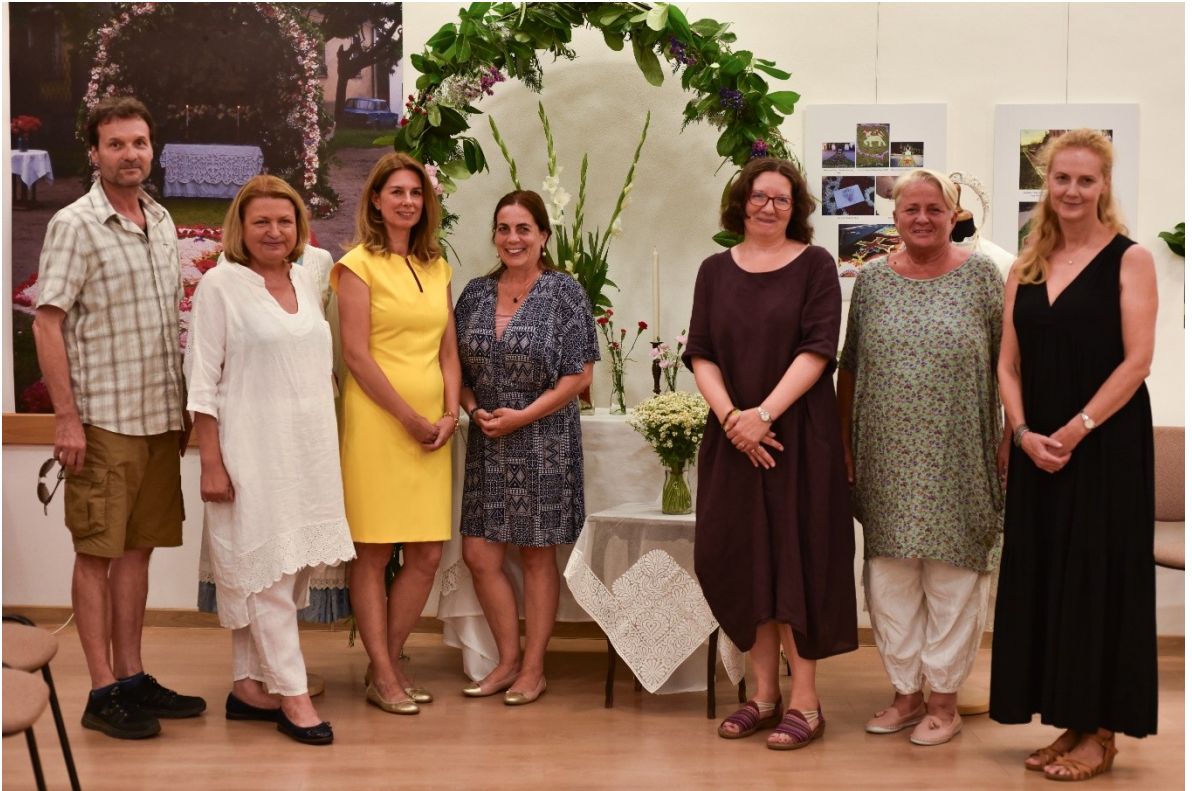
Az Öregiskola munkatársai a búcsúi helytörténeti kiállítás megnyitóján

2023-ben egy kiállítás nyílt meg „Virágból szőtt imádság” címmel