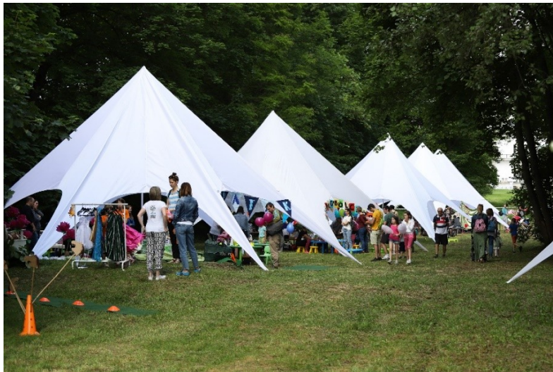
Intézményi sátrak 2023-ban