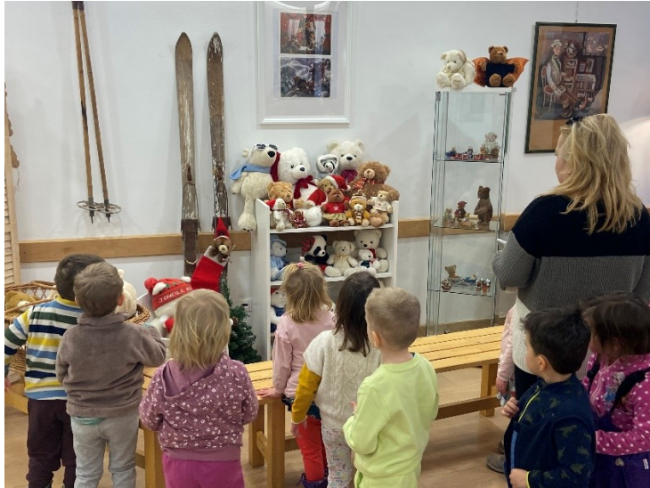
A Kispatak Óvoda Maci csoportja a Mackókiállításban – 2023. 02. 07.