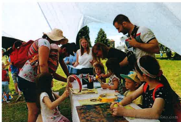
A NAMI hangszerbemutatóval egybekötött interaktív foglalkozása a Kastélyparkban