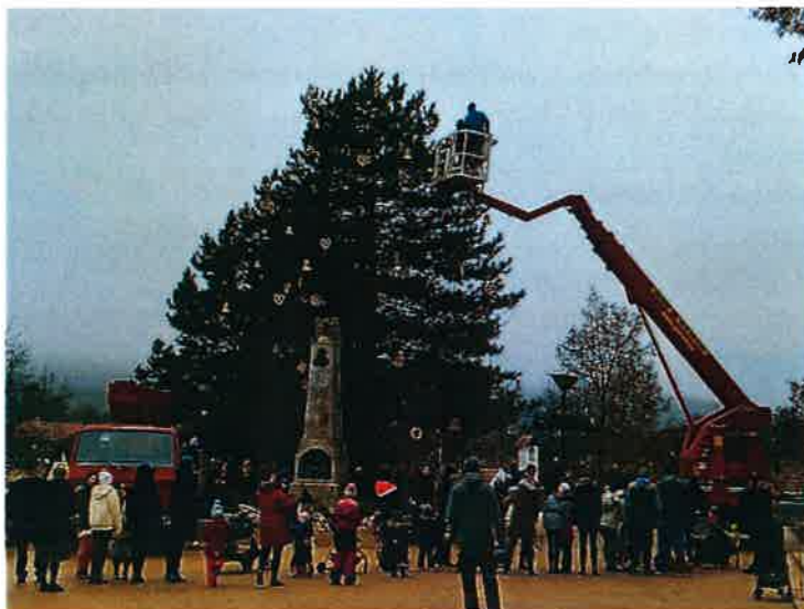
Közösségi fadísztítás advent 1. vasárnapján