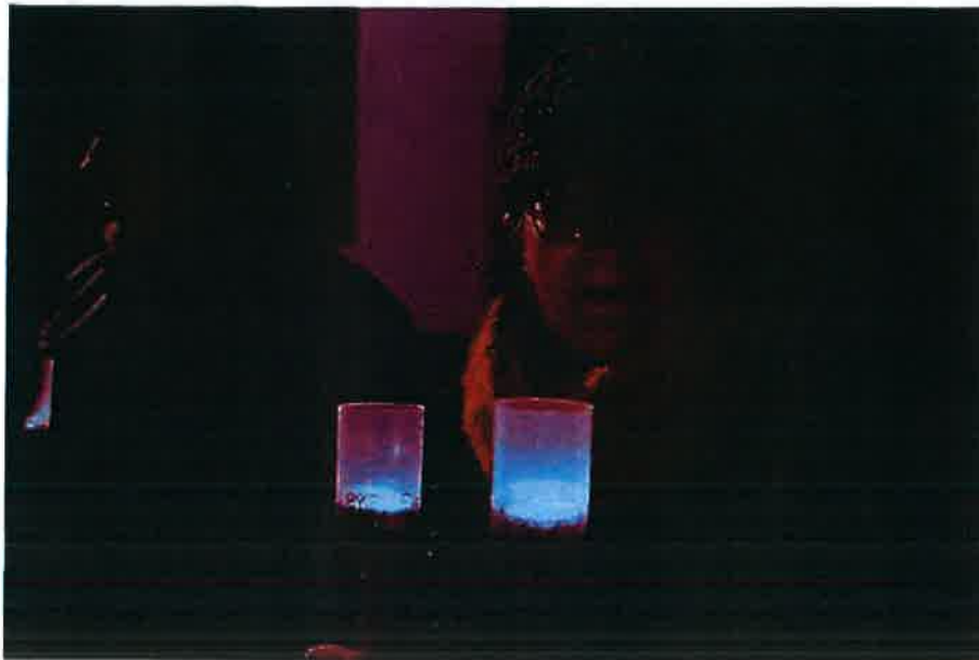
Borbála járás a mécsesfáklyákkal

A Szent Borbála napja idén advent vasárnapjára esett, így összekötöttük az adventi vasárnapok programjával, a Német Hagyományőrző táncsoport fellépésével. A Borbála-járás hagyományát megteremtve mécsesfáklyákkal vonultunk a Kolozsvár térre, ott mécsesgyújtás volt, tiszteletadás, és Kemenes Gábor atyával közösen imádkoztunk.