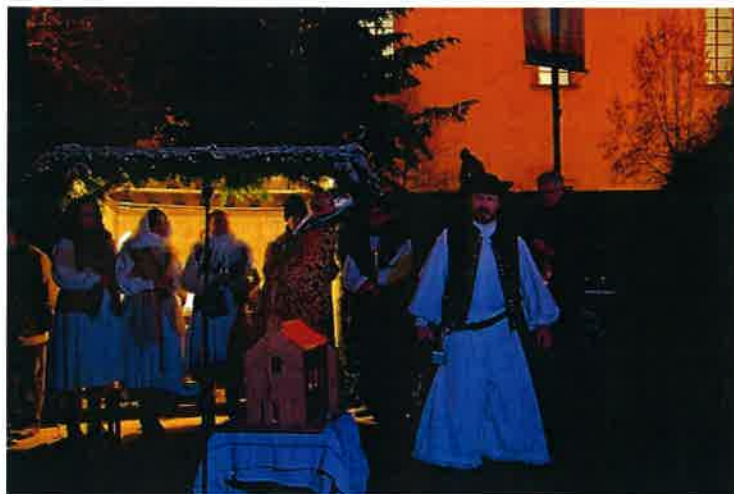
Betlehemes játék a Tisza István téren advent 3. vasárnapján

Advent 3. vasárnapján a Rézpatkó Néptáncsoport egy betlehemes játékkal örvendeztette meg a jelenlévőket, majd a szokásos adventi koncertre is sor került a templomban.