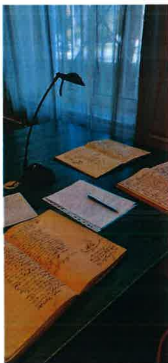
A Pest Megyei Levéltárban az egykori jegyzőkönyvek

A keresések folyamatosak, ebben az ADT adatbázisa a legnagyobb lehetőségünk.