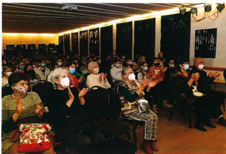
Még mindenki maszkban az Arany és Petőfi előadáson

- 2022. április 4. A tér mindent számon tart – Willany Leó Improvizációs Táncszínház előadása