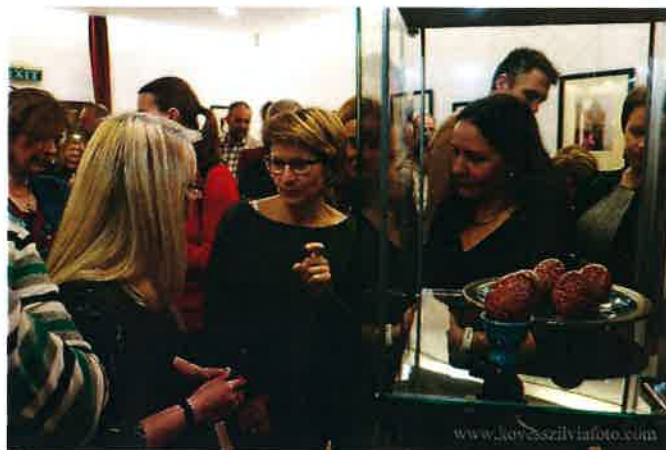
Kiállításmegnyitó, Írott tojások a Kárpát-medencéből, 2022. március 18.

felvonultató képei is. Alkotóink egy része hivatásos művész, másik részük amatőr alkotó. A képzőművészeti és a már megszokott, évről-évre újabb aktuális témákat felvonultató helyismereti kiállításunk mellett 2022-ben végre a népi iparművészet alkotásait is bemutathattuk: húsvétra készülődvén írott tojásokban gyönyörködhetnek a betérők.