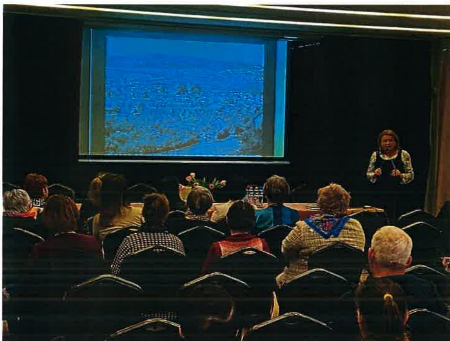
A könyvtárosi szakmai nap