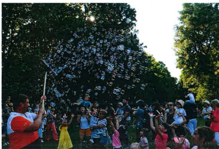
Buborékeregetés a Varázskastély családi fesztiválon

2022. pünkösdjén immáron ötödik alkalommal változtattuk igazi gyerekparadicsommá a Teleki–Tisza-kastély parkját több ezer kisgyermek és családjaik örömeire. Két év kihagyás után újra bizalmat szavaztak nekünk a családok a pünkösdői hosszú hétvégén, és velünk együtt ünnepelték a gyerekeket a mesés, zöld környezetben.