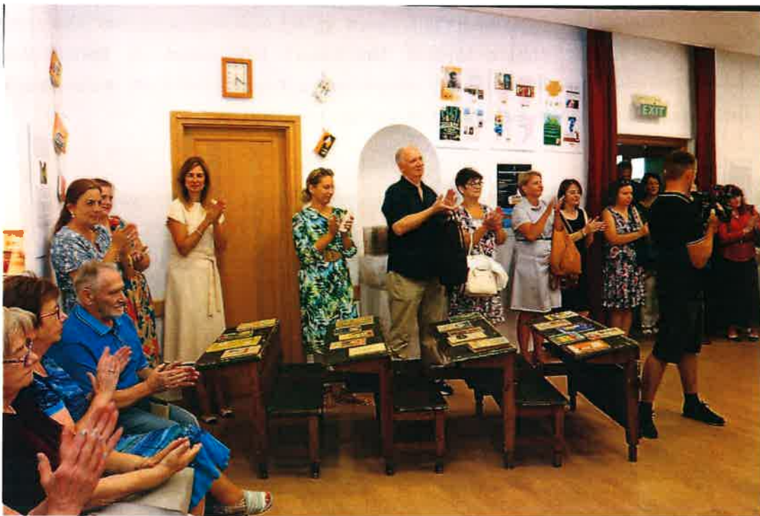
A 120 éves Nagykovácsi könyvtárügye kiállítás megnyitója

A kiállítás tiszteletére visszatértek a Veszprémi Nemzeti Színházból az ott vendégszereplő Öregiskolás padok. Az iskolás padokat a legújabb generáció is birtokba vette, és megható módon a régi diákok is elzarándokoltak, hogy kipróbálják a régen koptatott iskolapadokat.