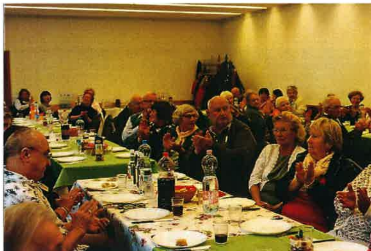
Vendéglátás az idősök világnapján