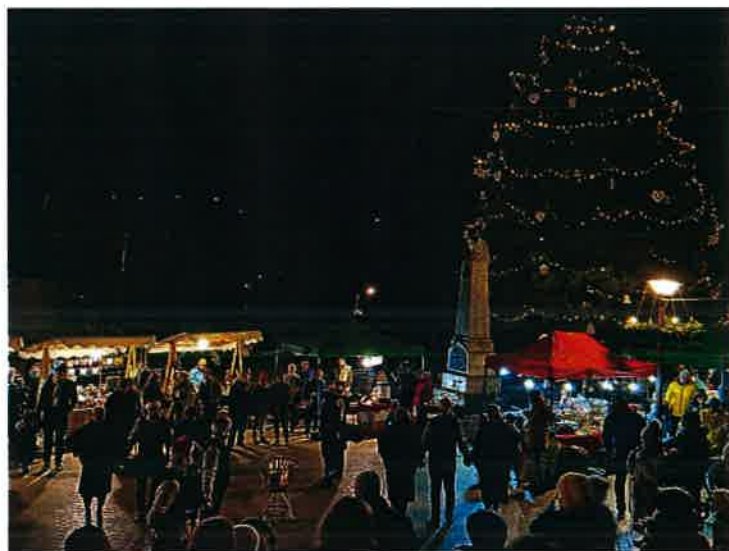
A Német Nemzetiségi Önkormányzat közösségének adventi műsora a Tisza István téren advent 2. vasárnapján

2022. december 4-én a 2. gyertya meggyújtását követően, fáklyákkal a kezünkben átsétáltunk a Bányász emlékműhöz. A fáklyavivők között számtalan Borbálát és Barbarát köszönthettük, névnapjukon együtt emlékeztünk Nagykovácsi bányászatára és bányászaira. Borbála-járásunkat hagyományteremtő cézzattal indítottuk el, jövőre ismét várunk minden kedves együttműködőt. Nagykovácsi Német Nemzetiségi Önkormányzata és közössége is velünk tartott a Borbála-járáson, majd a közös, tiszteletteljes mécsesgyújtást követően, a Tisza István térre visszatérve egy vidám adventi műsorral ajándékozták meg a jelenlévőket.