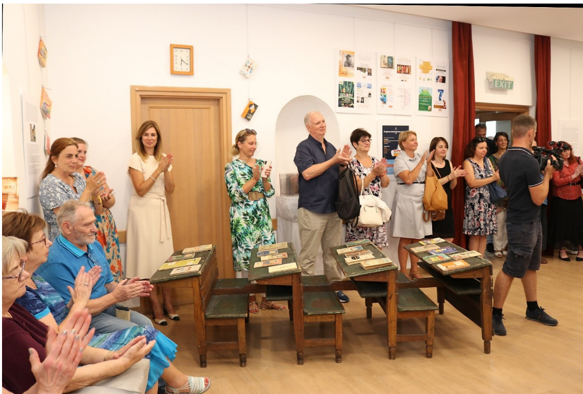
A 120 éves Nagykovácsi könyvtárügye kiállítás megnyitója

A kiállítás tiszteletére visszatértek a Veszprémi Nemzeti Színházból az ott vendégszereplő Öregiskolás padok. Az iskolás padokat a legújabb generáció is birtokba vette, és megható módon a régi diákok is elzarándokoltak, hogy kipróbálják a régen koptatott iskolapadokat.