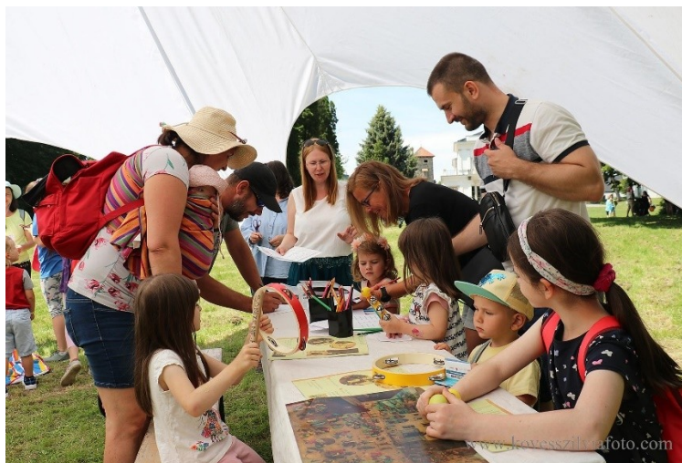
A NAMI hangszerbemutatóval egybekötött interaktív foglalkozása a Kastélyparkban