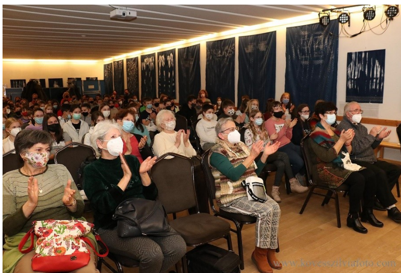
Még mindenki maszkban az Arany és Petőfi előadáson