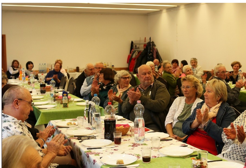
Vendéglátás az idősök világnapján