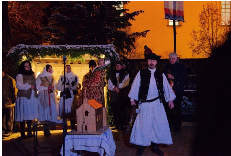
Betlehemes játék a Tisza István téren advent 3. vasárnapján

Advent 3. vasárnapján a Rézpatkó Néptáncsoport egy betlehemes játékkal örvendeztette meg a jelenlévőket, majd a szokásos adventi koncertre is sor került a templomban.