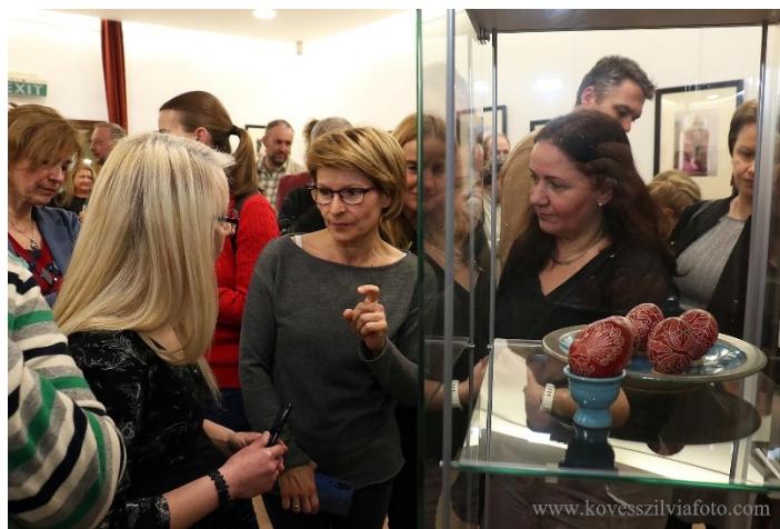
Kiállításmegnyitó, Írott tojások a Kárpát-medencéből, 2022. március 18.

felvonultató képei is. Alkotóink egy része hivatásos művész, másik részük amatőr alkotó. A képzőművészeti és a már megszokott, évről-évre újabb aktuális témákat felvonultató helyismereti kiállításunk mellett 2022-ben végre a népi iparművészet alkotásait is bemutathattuk: húsvétra készülődvén írott tojásokban gyönyörködhetek a betérők.