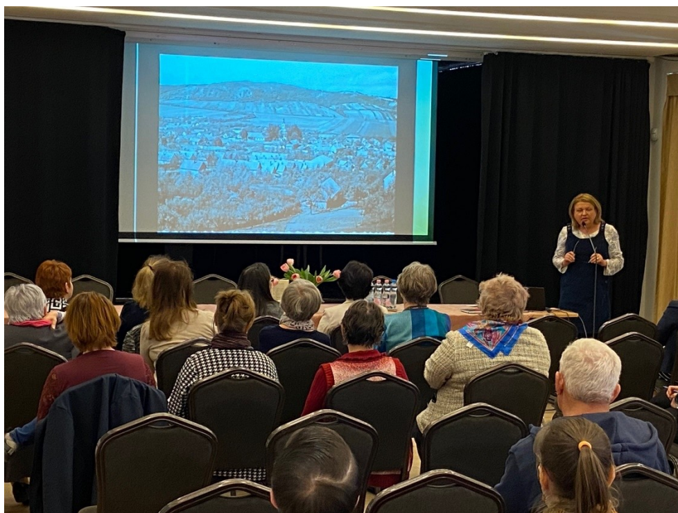
A könyvtárosi szakmai nap