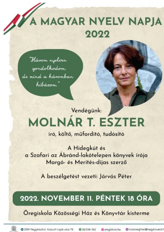
A magyar nyelv napja esemény plakátja Egri Anikó munkája

-November 22-től tömbösített nyitvatartással voltunk nyitva, heti 25 órát, a hét 3 középső napján. Hétfőn és pénteken a könyvtárosok az olvasóktól ajándékba kapott több mint 300 könyvet bevételezik az intézményi laptopokon. Folyamatosan kapunk jó állapotú ajándék könyveket, melyeket a hátsó irodában tárolunk, ezek bevételezésére az év közbeni folyamatos nyitvatartás és a rendszeres Bookline-rendelések Szirén adatbázisba bevitele mellett csak részidők jutnak, így ez a lehetőség kapóra jött nekünk.