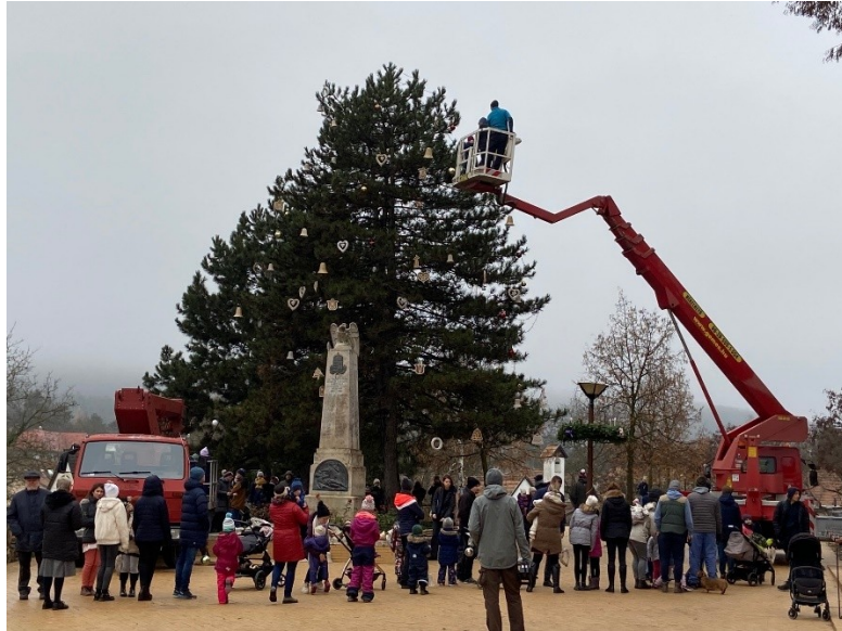
Közösségi fadíszítés advent 1. vasárnapján