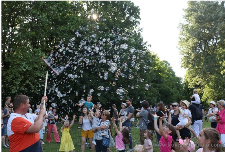
Buborékeregetés a Varázskastély családi fesztiválon

2022. pünkösdjén immáron ötödik alkalommal változtattuk igazi gyerekparadicsommá a Teleki–Tisza-kastély parkját több ezer kisgyermek és családjaik örömeire. Két év kihagyás után újra bizalmat szavaztak nekünk a családok a pünkösd hosszú hétvégén, és velünk együtt ünnepelték a gyerekeket a meseszép, zöld környezetben.