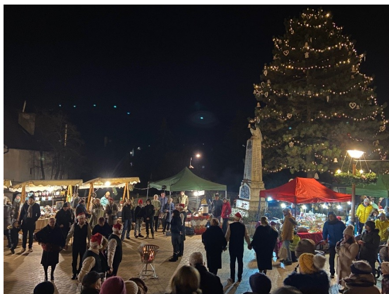
A Német Nemzetiségi Önkormányzat közösségének adventi műsora a Tisza István téren advent 2. vasárnapján

2022. december 4-én a 2. gyertya meggyújtását követően, fáklyákkal a kezünkben átsétáltunk a Bányász emlékműhöz. A fáklyavivők között számtalan Borbálát és Barbarát köszönthettük, névnapjukon együtt emlékeztünk Nagykovácsi bányászatára és bányászaira. Borbála-járásunkat hagyományteremtő cézzal indítottuk el, jövőre ismét várunk minden kedves együttműködőt. Nagykovácsi Német Nemzetiségi Önkormányzata és közössége is velünk tartott a Borbála-járáson, majd a közös, tiszteletteljes mécsesgyújtást követően, a Tisza István térre visszatérve egy vidám adventi műsorral ajándékozták meg a jelenlévőket.