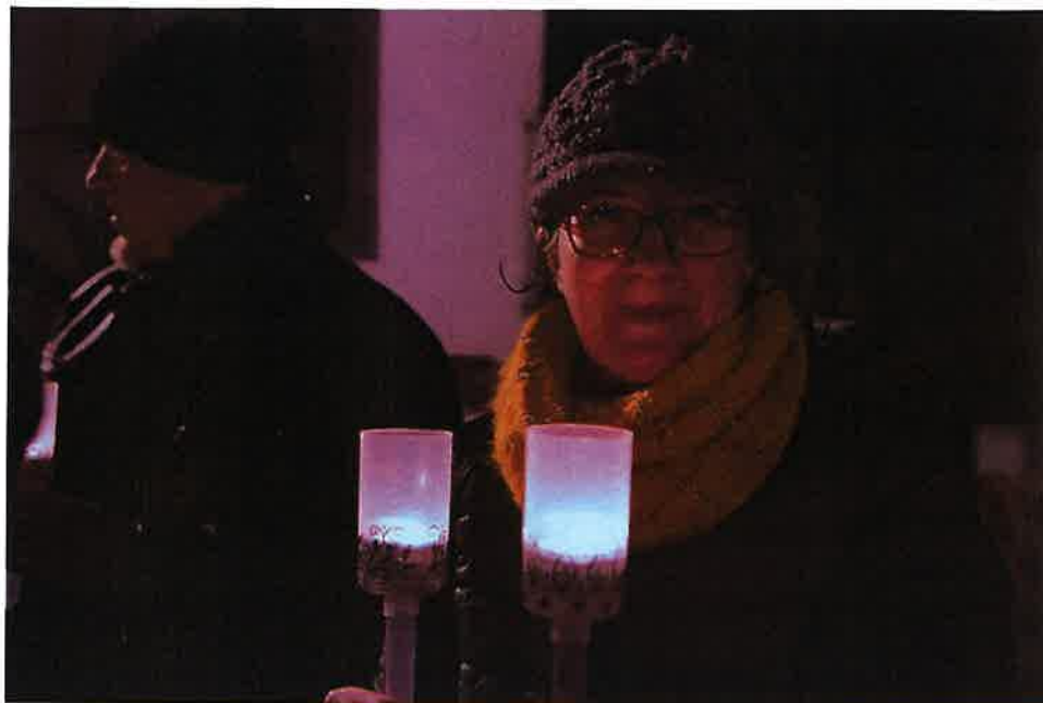
Borbála járás a mécsesfáklyákkal