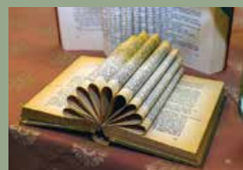
KÖNYVTÁROS SZAKMAI NAP