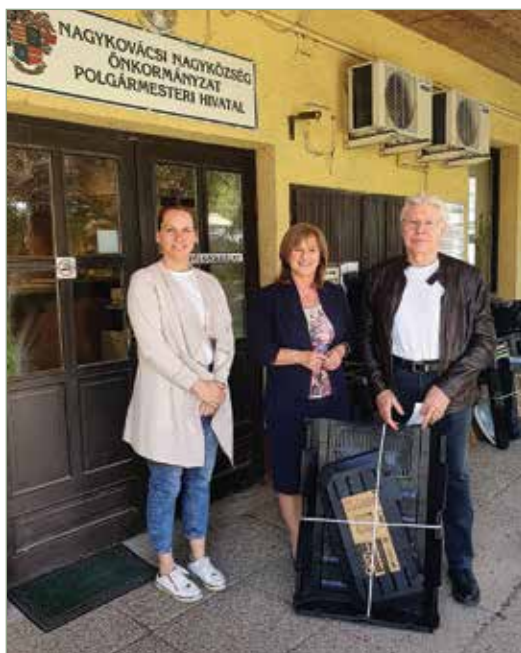
Első komposztláda átvétele

A környezetvédelemre stratégiai területként tekintünk Nagykovácsiban. Elkészült a Klímastratégia, amely az életminőségünket alapvetően meghatározó