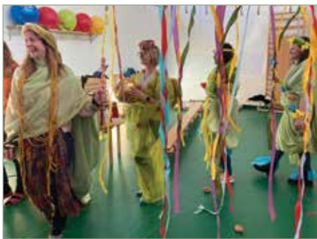
Erdei tündérek felvonulása

A gyakorlatok egymáshoz kapcsolódó játékos és mozgásos elemeket tartalmaztak, melyek mindegyike az önkifejezés, a kreativitás és a képzelet erejét hívta segítségül. Számtalan színes feladat, játék alkotta a repertoárt, melyhez olyan eszközöket és módszereket használtak, melyeket minden kollégánk remekül tud adaptálni saját óvodai közegébe. A program minden ízében ránk volt szabva. Egyszerre volt lendületes, innovatív, gyermeki lelkünket feltáró és pozitív kicsengésű. Hihetetlen szakmai töltkezést jelentett.