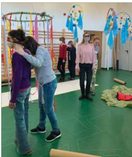
Érintéssel vezetjük egymást a Varázserdőben