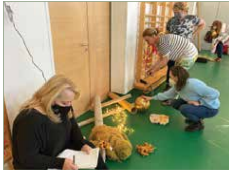
Készül a mese a Tűzmanóról

Erdei vándorút tematikájába építették bele képzőink a módszertani repertoárunkat gazdagító játékokat, kihívásokat jelentő mozgásos és csapat feladatokat. A fenntarthatóság jegyében hulladékból alkottunk bábokat, írtunk mesét és adtuk elő (20 perc alatt, ami ugye még egy óvodapedagógusnak is komoly kihívás). Mindezt fantasztikus minőségben! Vezetők egymást hangfolyosón és bekötött szemmel némán csak érintéssel jelezve az utat az erdő labirintusában. Túlkiabáltuk a vihar erejét és így is felismertük egymás hangját. Kérdéseket minimalizálva igyekeztünk kitalálni, hogy mely természetben létező állat, növény vagy jelenség van hátunkra írva (a szentjánosbogár, a szikla és az odú nem volt egyszerű). Erdi tündéreké varázsoltuk és öltöztettük kollégánkat maradék anyagokból, akik így vonultak végig a réti kifutón. Táncoltunk karikára rögzített selyemszalagokkal, papír lángnyelvekkel, rajzot alkotva a falra, sőt talajon gurulva is ment mindez. Festettünk zenére bottal ritmust kopogva, majd beleálmodtuk az absztrakt formákba fantáziánk szülőtteit, kitaláltuk, mit lehetne a kész alkotással még tovább játszani,