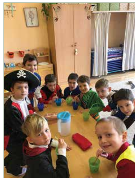
Farsang a Barackfa csoportban

Szita, szita, péntek Vége van a télnek kikeletet köszönteni jönnek a népek?