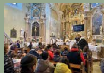
FARSANG A PLÉBÁNIÁN