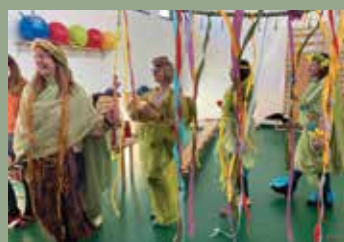
TOVÁBBKÉPZÉS AZ OVIBAN