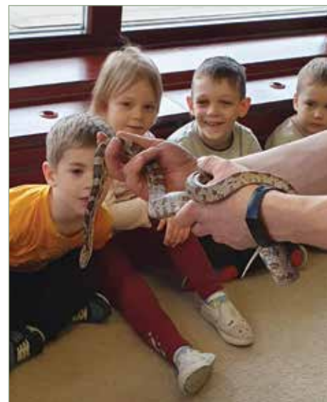
Ez tényleg nem gumikígyó

Szívből örültünk, hogy „Házhoz jött a Vadaspark” és a természet a Kispatak Óvodába.