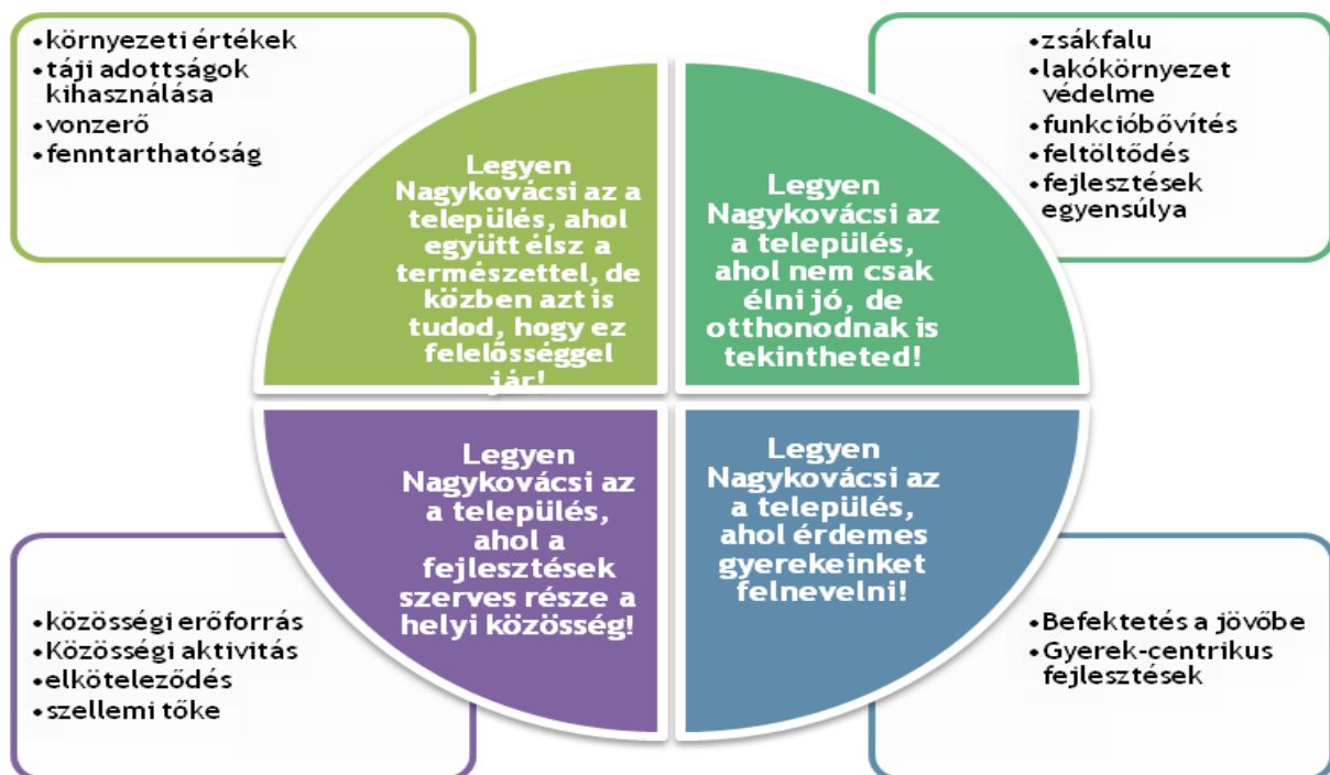
3. ábra Jövőkép (Településfejlesztési Koncepció)

Nagykovácsi Nagyközség Önkormányzata 2015 márciusában elfogadta a Településfejlesztési Koncepciót, amelynek célja, hogy a lakosság és a településvezetés számára legyen olyan dokumentum, amely tartalmazza Nagykovácsi fejlődését elősegítő célokat és hozzásegíti a község fejlesztéséért felelős képviselőket a megfelelő döntések meghozatalához. Szintén elkészült az Integrált Településfejlesztési Stratégia is, amelynek feladata, hogy olyan célokat és azok megvalósításához szükséges akciókat jelöljön ki, amelyek megalapozzák a település korszerű és harmonikus, a lakosság érdekeit szolgáló fejlődését.