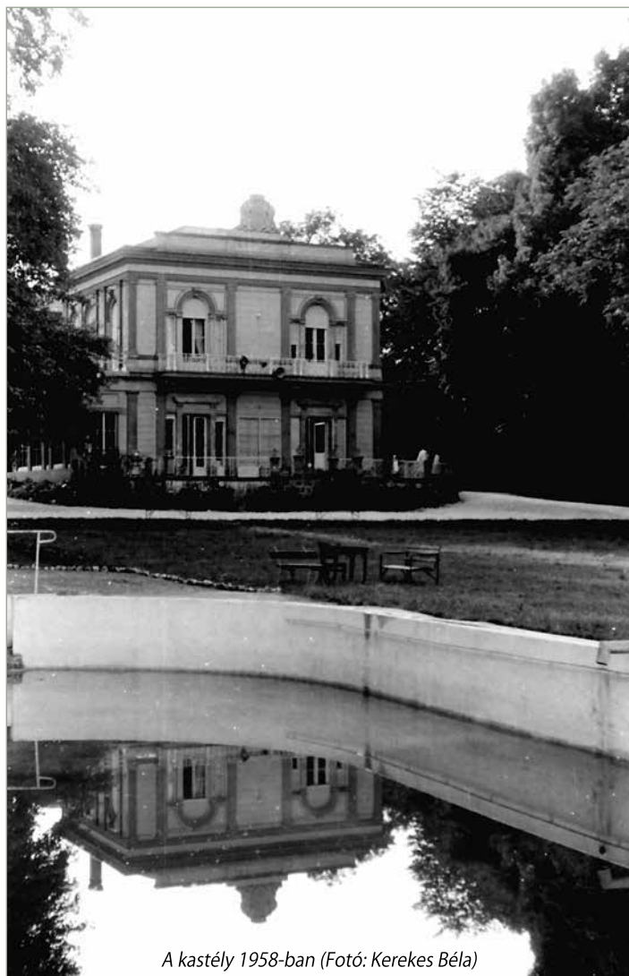
A kastély 1958-ban

A második világháború előtti légi felvételeken már látható a kastély területén épült torony is.