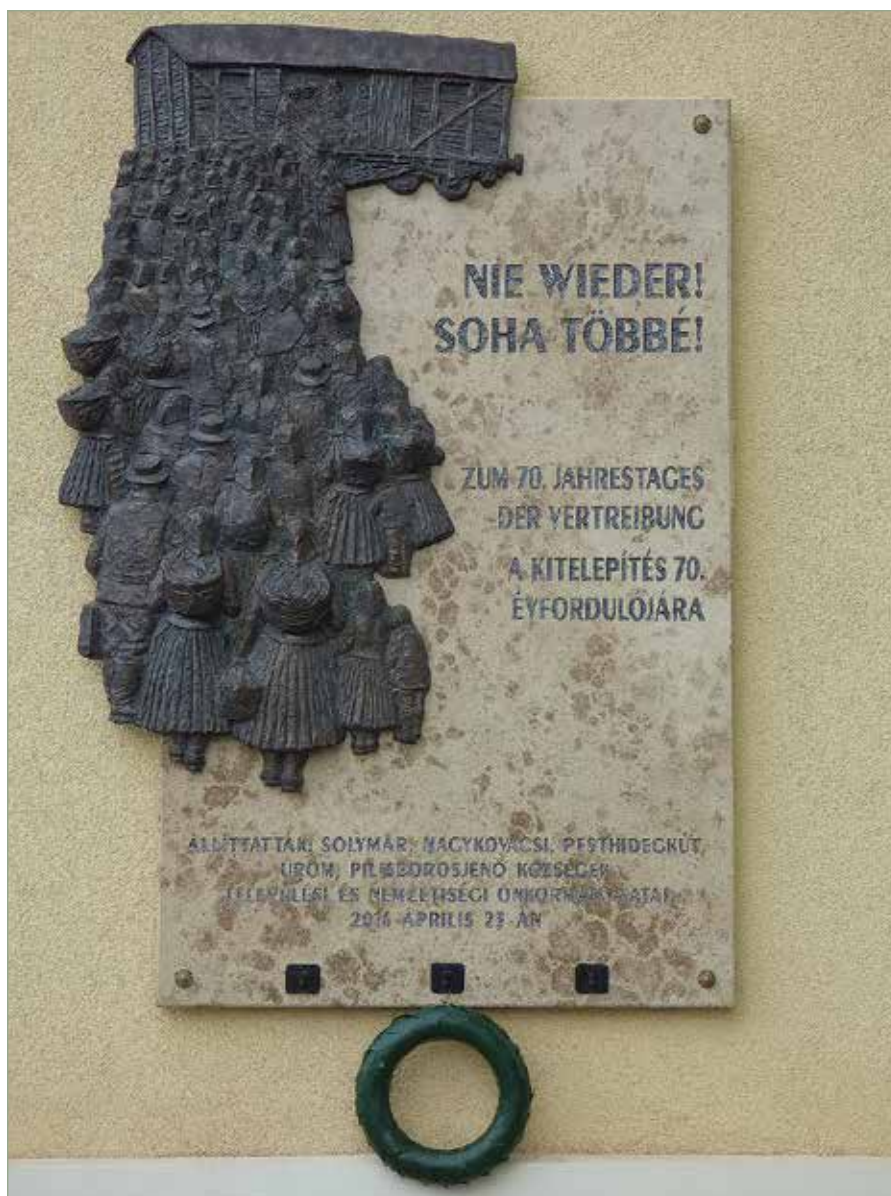
Kitelepítési emléktábla a solymári vasútállomáson

Isten veled, Hazánk! – ezzel a felirattal és magyar zászlóval díszítve indult el egy szerelvény, 75 éve az ismeretlen felé.