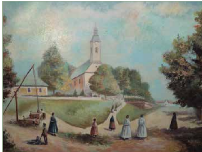
Honvágy (emlékezet alapján készült festmény Németországból)

A faluból több, mint 2000 embert, 600 családot vagoníroztak be. Eltűnt egy teljes falu. Magával vitte a falu 250 évének élő emlékeztetőit; az ünneplés, a mindennapok kultúráját, a gazdálkodás kultúráját; a hagyományokat, a szokásrendszert, a felbecsülhetetlen értékű közösségi tudást a tájról, a környezetről, az erdők-mezők, szántóföldek növényeiről, virágairól, állatairól. Elvinni már nem tudták, mert mindez valahol szilánkjaira törött, majd elporladt: a falu akkori közösségét. Mikor tört el? Röviddel a háború után, amikor