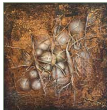
Az aranykor vége 1.