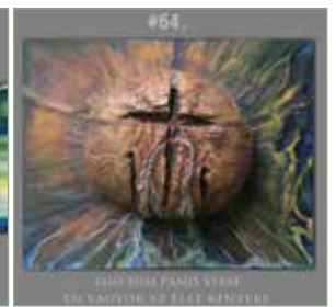
a kiutat kereső keresztyén alapértékek: - EGO SUM PANIS VITAE / ÉN VAGYOK AZ ÉLET KENYERE #64

Üdvözléssel: Vladár Csaba képzőművész, ma, 2020.11.23.