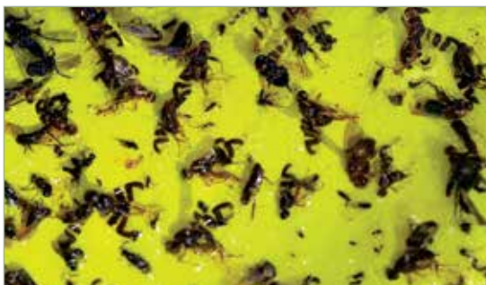
PALZ Csalomon csapdába ragadt legyek