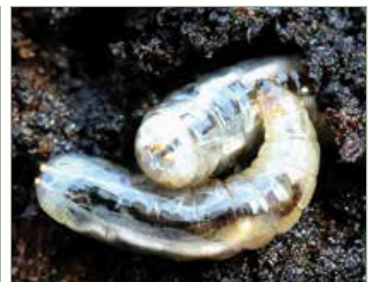
Dióburok fúrólégy lárvák által péppé rágott dióburok

Nézzük meg, mit is tehetünk valójában. A kisebb fák esetében érdemes a diót levetni , mielőtt azok maguktól lehullanak és a lárvák a burokból kimászva bebábozódnak a talajba. Ezt követően hántsuk le a dióburokot. Ehhez gumikesztyű erősen ajánlott, mert a burokban lévő juglon az egyik legerősebb növényi festék. A lehántott burokban lévő lárvákat elpusztíthatjuk, pl. egy vödörben leforrázva őket. A diót ezután erős vízszűrővel megtisztíthatjuk a lárvák tevékenységének nyomaitól. A dióburok légy nem károsítja a dióbelet! Nagyon fontos, hogy ezt követően a diót megszársítsuk, különben meg fog penészedni! Egyébként a mosás, majd a szárítás az ipari betakarításnak is részmuvelete. Sok száz megfeketedett dió megtörése után saját tapasztalatom alapján állíthatom, hogy csak nagyon kis hányadát (~1-2%) kellett kidobni.