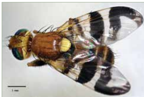
Nyugati dióburok-fúrólégy imágója

Madách Imre Az ember tragédiájában írja ezt azon tanakodva, hogy leszakítsa-e a gyümölcsöt a tudás fájáról. Számomra nem kétséges, hogy a megfelelő tudást megszerezve kell célszerűen cselekedni. A kérdés az, hogy tudunk-e tenni valamit. Nos az interneten, a youtube-n és a közösségi oldalakon nehéz a jó megoldást fellelni, de annál inkább találhatunk elképesztő sületlenségeket (persze nem csak ebben a témában). A skála a fák kivágásától a lehullott lomb és a diók elégetéséig terjed. Felejtjük el a diófák kivágását, hiszen a cipőt sem dobjuk ki ha koszos lesz, hanem kipucoljuk, s maguknak a fának semmiféle károsodást nem okoz a nyugati dióburok-fúrólégy. A levelek megsemmisítése sem megoldás, hiszen a lárvák nem is kerülnek kapcsolatba a levelekkel, ráadásul az égetés során sok dioxin keletkezik, mely az egyik legerősebb ismert mérgező anyag az élőlényekre.