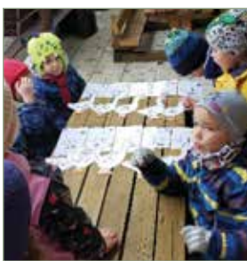
Libanóta, libasorban: Nincs szebb madár mint a lúd, nem kell néki gyalogút...

az udvaron kialakított különböző játéktérleteken zajlottak. Minden kis állomással, feladattal a Márton napjának hagyományait, dalait, dalos játékeit, mondókat idéztük fel.