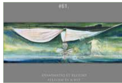
a „szabadság vitorlásai – EXANIMATIO ET RELIGIAO / FELELEM ÉS HIT #61”