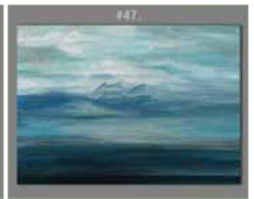
a „természet, mint Isten önarcképe – FELHŐVITORLÁS #47”