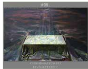
a „utolsó vacsora üres asztala – CONSUMMATUM EST / BEVÉGEZTETETT #09”

A befogadónak, a cím és a mű összehatásának értelmi és érzelmi megfejtésével – a művész „néha az összeomlás határán egyensúlyozó, néha lelkesítő segítségével” –, de egyedül kell értelmeznie olyan örök jelképeket, mint: