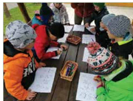
Márton napi kalandtúra és képkereső

Mindenhez felhasználva óvodás gyermekeink képzelő erejét, zenei ismereteiket, kreativitásukat és az együtt játszás erejét, ami minden csoportban összeforrasztja egységéé olvasszja a Kispatak Óvodásokat hagyományaink által.