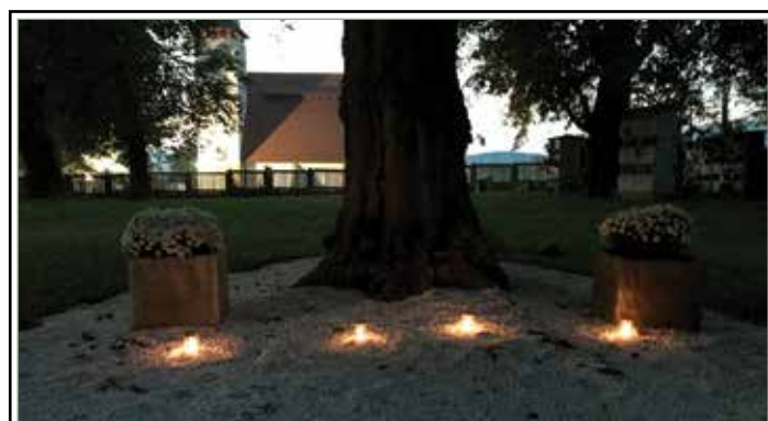
Temetői emlékező hely a Nagykovácsi temetőben