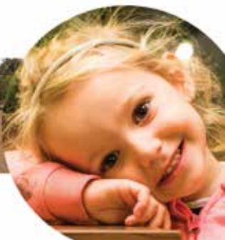
Nagykovácsi Önkormányzata az Alapítvány fő támogatója