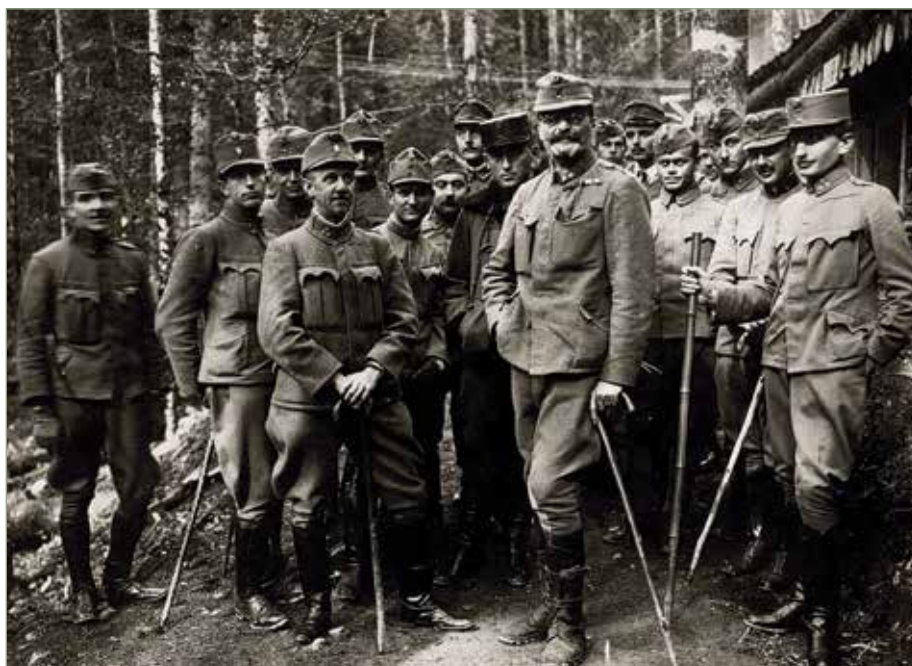
Gróf Tisza István az olasz fronton 1917-ben katonái között

A gr. Tisza István Nemzeti Kör kezdeményezésére úgy döntöttek a képviselők, hogy javasolják a BKK-nak, hogy a 63-as busz Ady E. utcai megállóját nevezzék át Teleki-Tisza-kastély megállóra.