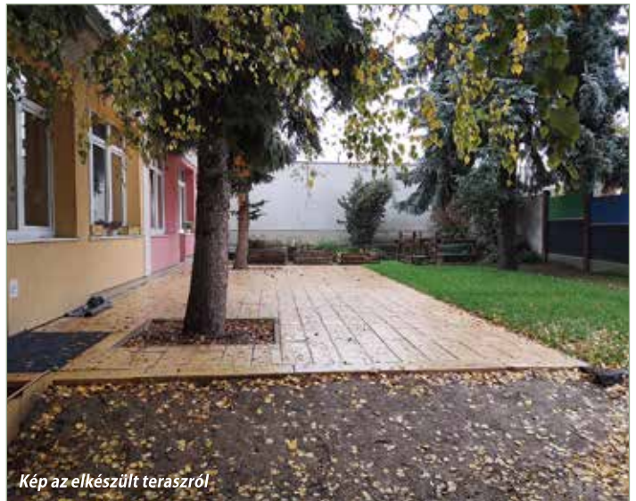
Kép az elkészült teraszcsoportról

Szeretnénk ha terveink 2021 első felében teljesen megvalósulhatnának, reméljük