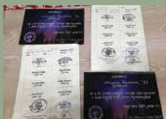
HEGYEN- VÖLGYÖN ÁT