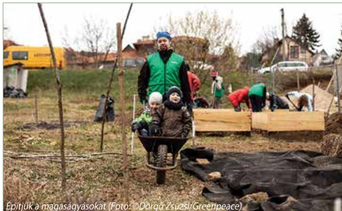
Építjük a magaságásokat

Az bizonyára sokaknak nem újság, hogy településünkön közösségi kert van. Azt viszont talán kevesebben tudják, hogy 2019 tavaszán a NATE csatlakozott a Greenpeace menzaforrádalom programjához, és a közösségi kertben hárman a helyi Waldorf óvodának is természetünk vegyszermentes zöldséget. A termesztés a Greenpeace segítségével készült magaságásokban történt.