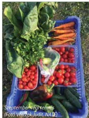
Szeptember végi termés