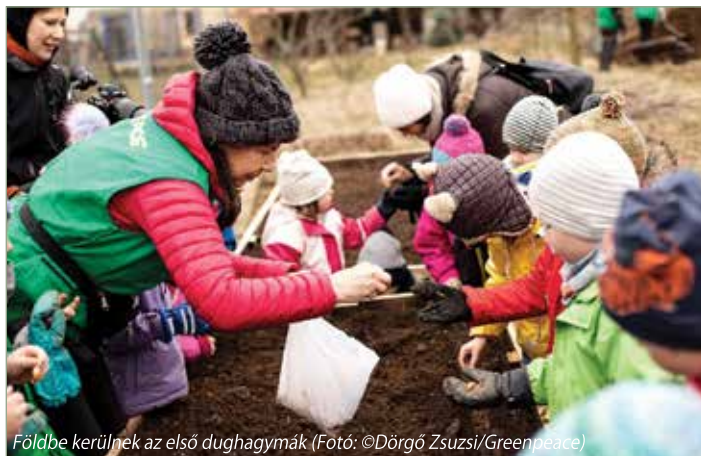
Földbe kerülnek az első dughagymák