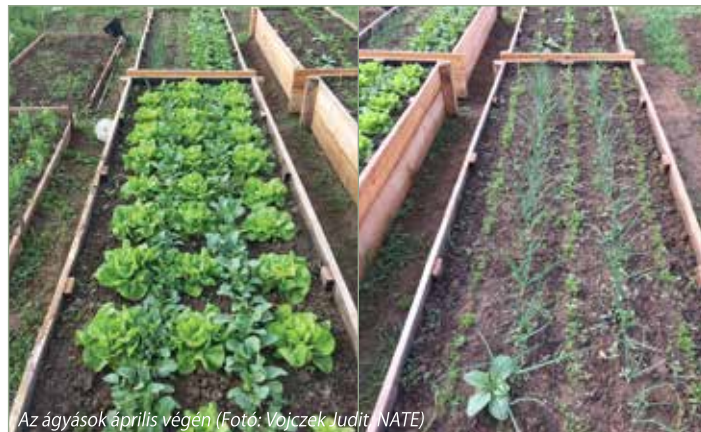
Az ágyások április végén

Tavasszal már vittünk az oviba retket, újhagymát, salátát, petrezselyemzöldet, spenótot, később sárgarépát, karalábét is. Aztán beköszöntött a nyári szünet, az ekkor termelt zöldségeket részben saját magunk elfogyasztottuk, részben befőztük. Őszi a választék kibővült céklával, mángolddal, paprikával, paradicsommal, leveles kellel, uborkával, és végül sütőtökkel. Az együttműködés az ovival ebben az évben is folytatódik.