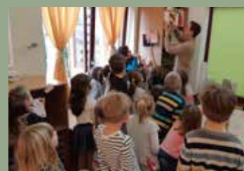
A TERMÉSZET ÚTJAIN