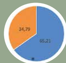
MI KÉRDEZTÜNK, ÖNÖK VÁLASZOLTAK