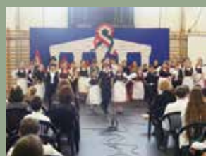
MÁRCIUSI IFJAK NYOMÁN