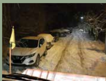
HA ESIK A HÓ...