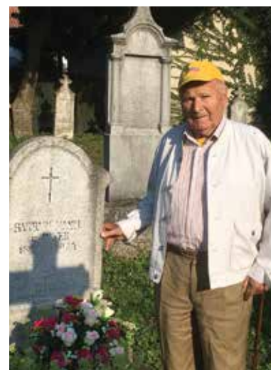
Édesanyja sírjánál a Nagykovácsi temetőben. 2018. augusztus 21.

Nagykovácsi Német Nemzetiségi Önkormányzat és közössége képviseletében