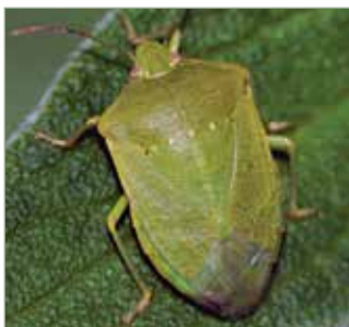
A zöld vándorpoloska telelő példányai barnás színűek is lehetnek.

A ázsiai márványospoloska ( Halymorpha halys ) és a zöld vándorpoloska ( Nezara viridula ) egyaránt a címeres poloskák családjába tartozik. Az előbbi őshazája Kelet-Ázsia. Először az Egyesült Államok hurcolták be, ahol 1998-ban észlelték első példányaikat. Valószínűleg gépek csomagoló anyagaiba rejtőzve érkezett; így szabadult rá a „fejlett” világra számos inváziós cincérfaj is. Két évtized alatt az USA 41 államában és Kanadában lett a gyümölcsösök komoly kártevője. Európába először csak 2004-ben jelezték, de a késlekedést a karanténszolgálatok és a növényvédelem hatatos tétlenkedésének köszönhetően hamar behozta, s mára szinte Európa minden országából kimutatták. Ne legyen kétségük, olyan kiváló az ökológiai alkalmazkodó képessége, hogy a többi világrést is hamarosan meghódítja.