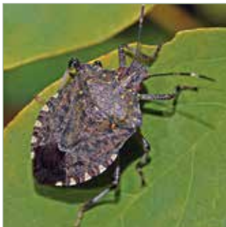
Szürkésbarna, néhol vöröses, szabálytalan és helyenként összefolyón feketeponozott, ezért látványa „márványos” hatást kelt.