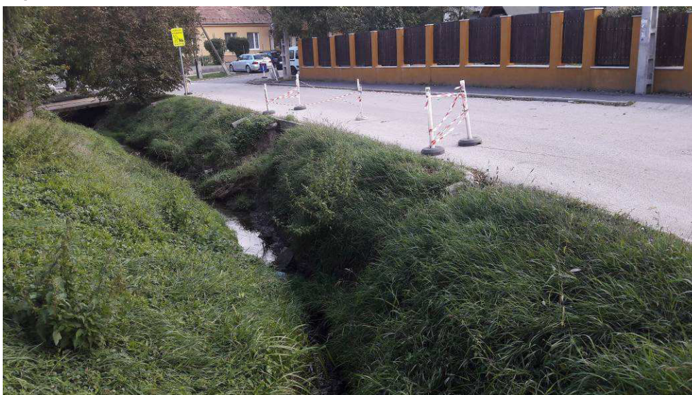
4.a/ A károsodott Ördögárok-patak, Kolozsvár köz az ideiglenes forgalomtereléssel