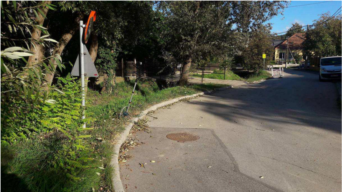
4.1.6.a/ A károsodott Ördögárok-patak, Kolozsvár köz