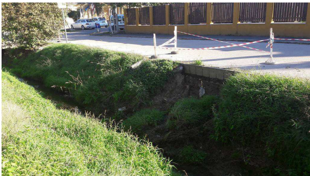
4.b/ A károsodott partfal a környezet suvadásával, útszegély tönkremenetellel