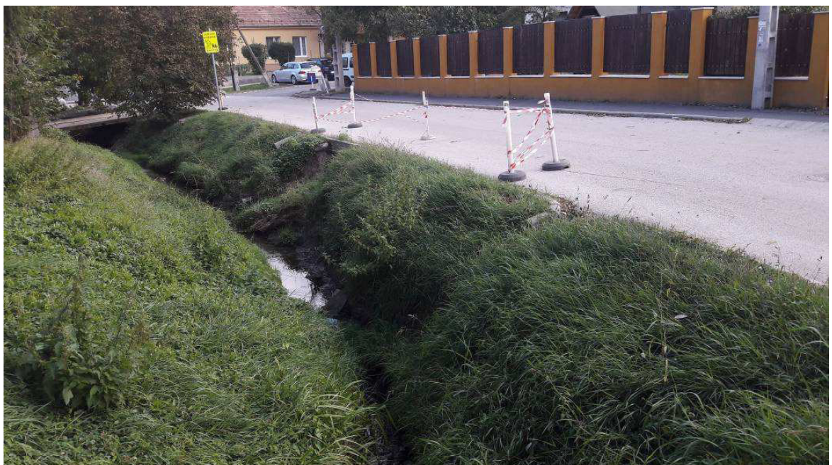
4.1.6.b/ A károsodott Ördögárok-patak, Kolozsvár köz az ideiglenes forgalomtereléssel