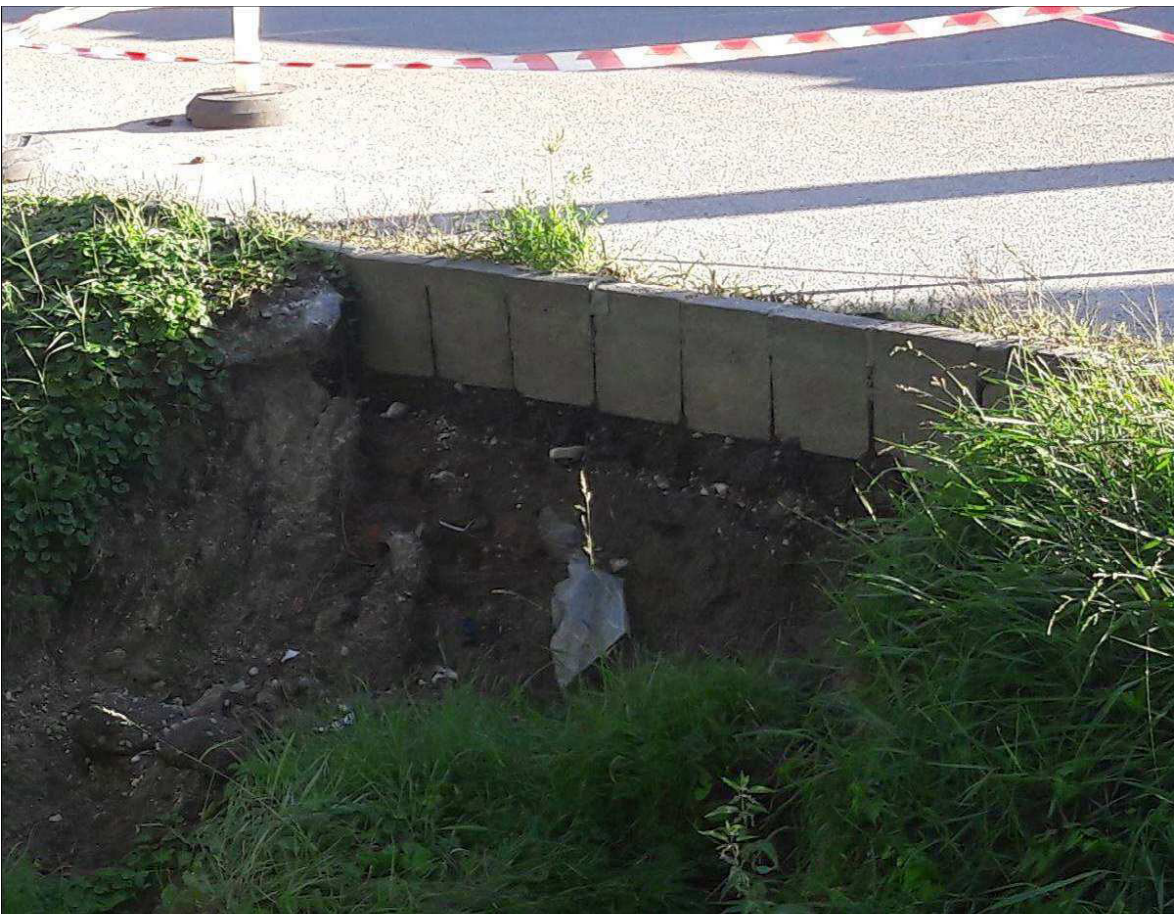
4.1.6.d/ A partfal suvadása, útszegély, útburkolat kimosódása, aláüregelődése a tönkremenetellel