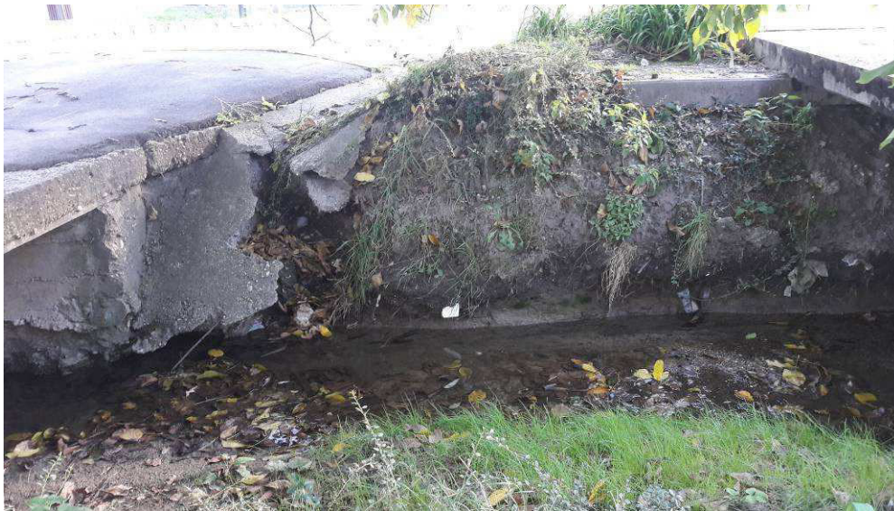
4.c/ A károsodott partfal a hídfők környezetének tönkremenetelével