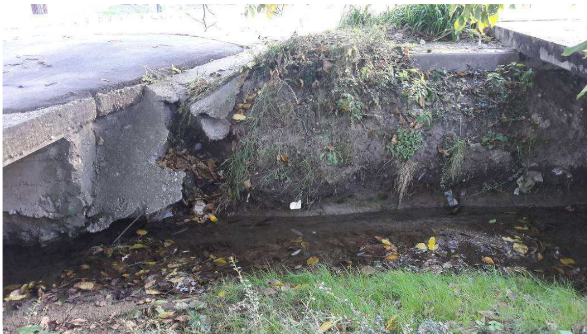
4.1.6.e/ A károsodott partfal a hídfők környezetének tönkremenetelével