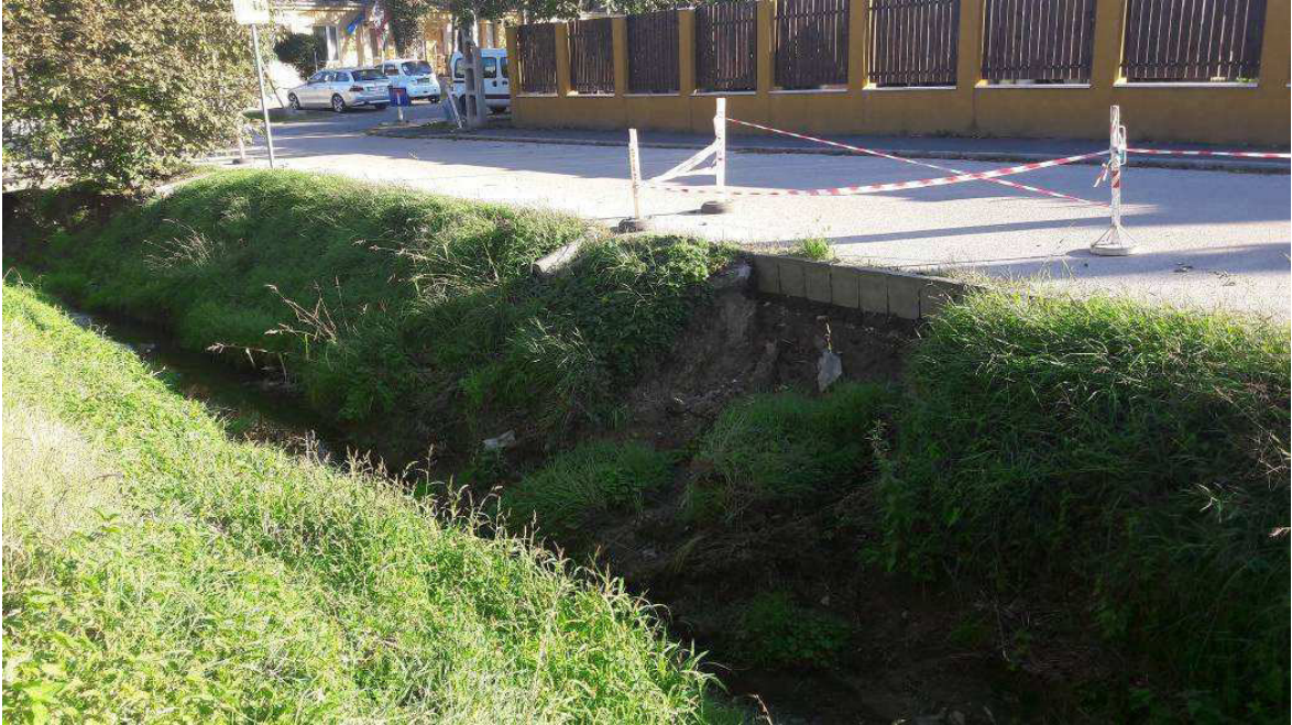
4.1.6.c/ A károsodott partfal a környezet suvadásával, útszegély tönkremenetellel