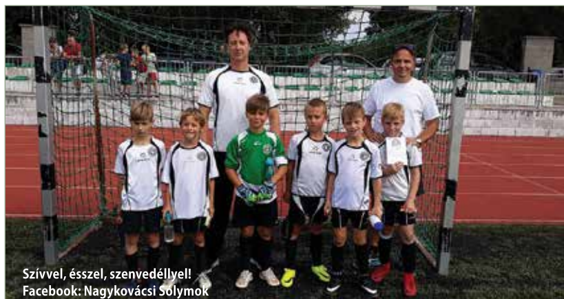
Szívvvel, ésszel, szenvedéllyel! Facebook: Nagykovácsi Sólymok