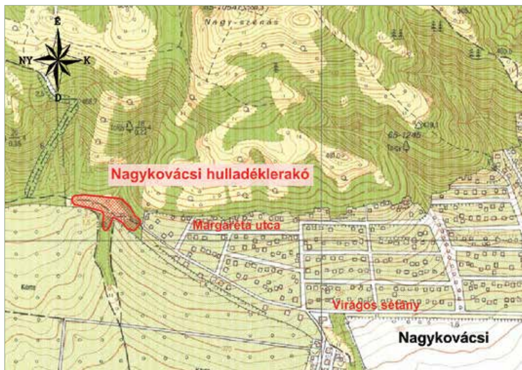
Nagykovácsi hulladéklerakó átnézeti helyszínrajza - tervező: Golder-MKM konzorcium

A fentiek ismeretében 2009. novemberében Nagykovácsi Nagyközség Önkormányzat Képviselő-testülete döntött, hogy „...a Duna-Vértes-Köze Hulladékgazdálkodási Társulás tagjai által 2010-ben benyújtani kívánt KEOP 7.2.3-2007-0002 számú pályázatban Nagykovácsi Nagyközség Önkormányzata nem tud részt venni. A Nagykovácsiban lévő rekultiválandó hulladéklerakóval összefüggő területrendezési eljárásokat nem tudja határidőben teljesíteni...” Ennek következtében Nagykovácsi kilépett a Duna-Vértes Köze Regionális Hulladékgazdálkodási Társulás KEOP