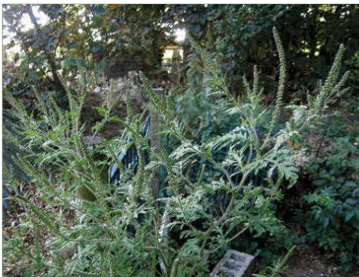
Virágzó ürömlevelű parlagfű.

Erosen allergén virágpóra igazi közegészségügyi problémává teszi, hiszen nálunk az összes allergiás negyede érzékeny a parlagfű pollenjére.