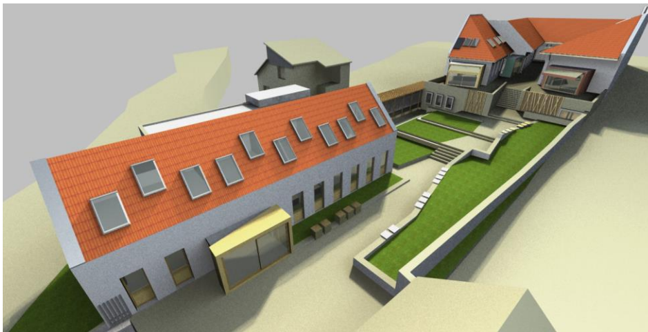
A B épület, az irodák bérlésére alkalmas tér (tervdokumentáció, látványkép)

Az épületek átadásával 2014 őszén Nagykovácsi Nagyközség Öregiskolája újjászülehetett, a közgyűjteményi-közművelődési feladatok ellátása méltó körülmények közé kerülhetett.