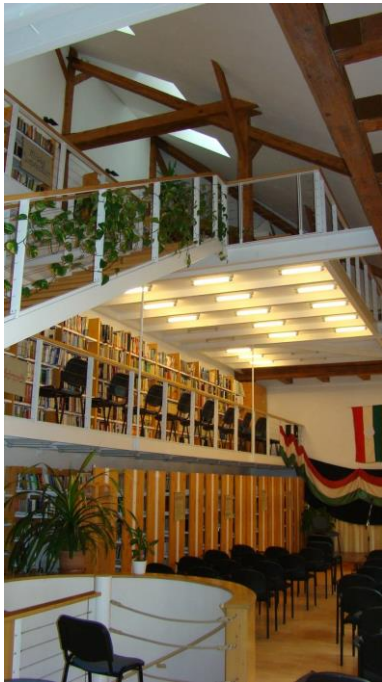
Az első október 23. az új „színházteremben”, 2007

A tetőszerkezet felújítása, a tetőfedés cseréje 1996-ban zajlott le. Az épület bal oldali szárnyának felújítása 2006-ban történt. Ekkor költözhetett a könyvtár ebbe a szárnyba, ahol egy kisterem egészítette még ki a lehetőségeket. A könyvtár állományát mozdítható, összetolható polcrendszerre helyezték el, így az „összecsukott” könyvtár terme lehetett a nagyterem.