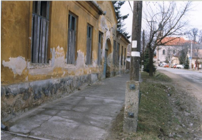
1996. Öregiskola

Az Öregiskola épülete, hiába állt a falu főutcájában, az új iskolával szemben, közel a Főtérhez apránként az enyészeté lett. Az építészeti bejárások egyértelműen azt állapították meg, szinte gazdaságosabb lenne az épület teljes elbontása. Műemlékvédelmi szempontból is értékelhetetlennek mutatkozott, helyi védelem alá sem került.