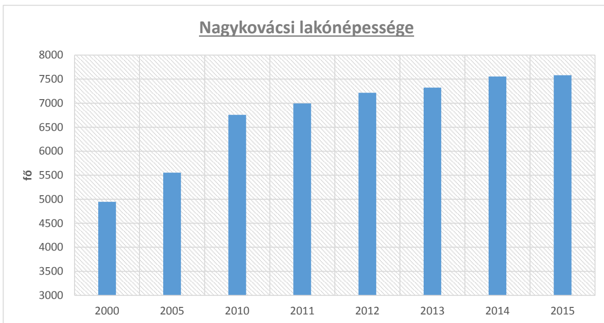
1. ábra Nagykovácsi lakónépessége