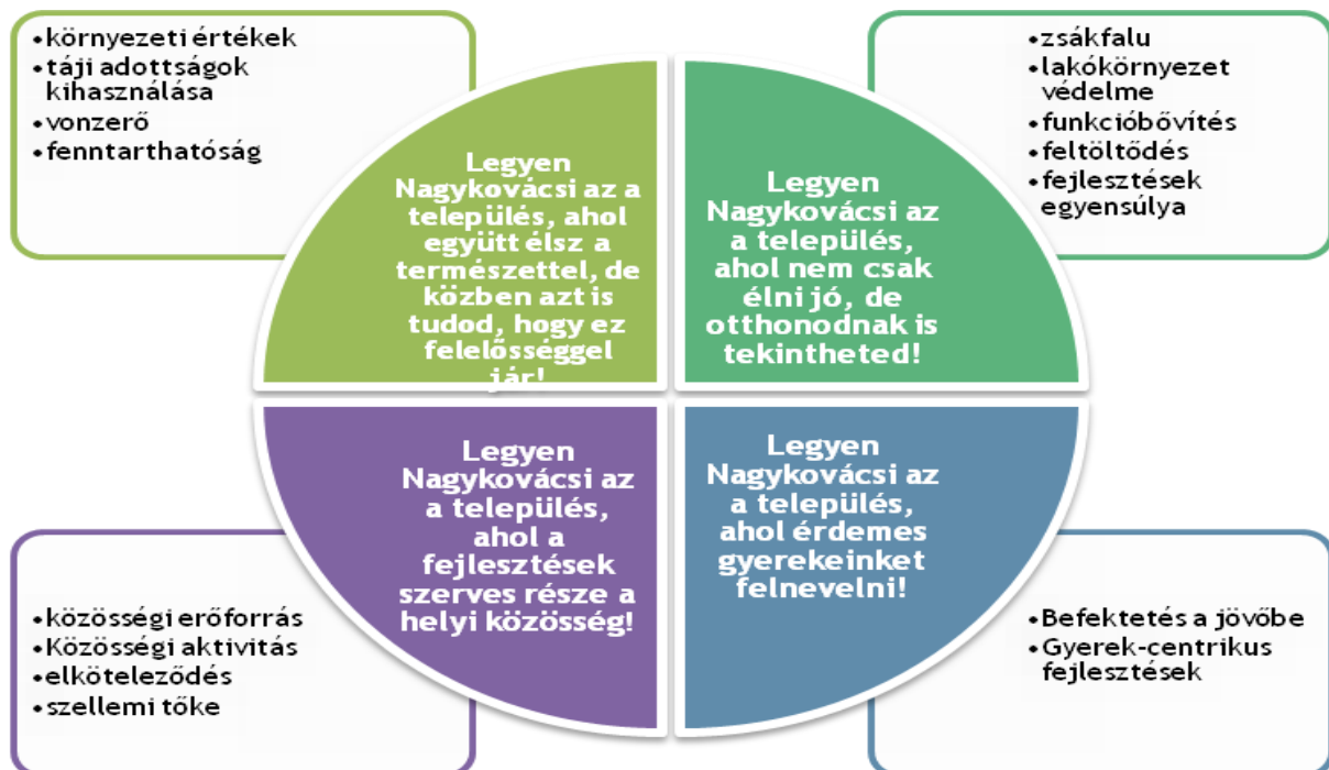
3. ábra Jövőkép (Településfejlesztési Koncepció)

Nagykovácsi Nagyközség Önkormányzata 2015 márciusában elfogadta a Településfejlesztési Koncepciót, amelynek célja, hogy a lakosság és a településvezetés számára legyen olyan dokumentum, amely tartalmazza Nagykovácsi fejlődését elősegítő célokat és hozzásegíti a község fejlesztéséért felelős képviselőket a megfelelő döntések meghozatalához. Szintén elkészült az Integrált Településfejlesztési Stratégia is, amelynek feladata, hogy olyan célokat és azok megvalósításához szükséges akciókat jelöljön ki, amelyek megalapozzák a település korszerű és harmonikus, a lakosság érdekeit szolgáló fejlődését.