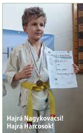
Hajrá Nagykovácsi! Hajrá Harcosok!

Hosszú, kemény felkészülő munka áll mögöttünk, melyet minden indulónk a legjobb tudása szerint végzett el. Volt, aki az utolsó időszakban heti 3-5 edzést is végigharcolt hetente.