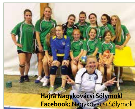
Hajrá Nagykovácsi Sólymok! Facebook: Nagykovácsi Sólymok