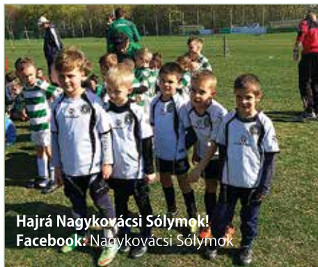
Hajrá Nagykovácsi Sólymok! Facebook: Nagykovácsi Sólymok

A hosszú, öt hónapos téli tornatermi edzések után végre kijutottunk a szabadba, a nagy füves pályára. Bár áprilisban a tavaszi időjárás kicsit megréft minket, ezért elég sokat kellett újra a termi edzést választanunk. Mindez azonban nem befolyásolta az U7-es kicsik jó kedvét az edzéshez, hozzáállásukat a focihoz. A heti két edzés továbbra sem változott és maradt az egy órás foglalkozás,