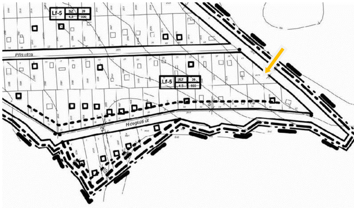
HÉSz SzT-2 Szabályozási Terv kivonata