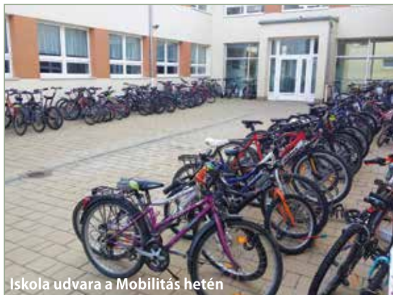
Iskola udvara a Mobilitás hetén

A címben feltett kérdésre tehát részemről a válasz: igen, nagyon bízom abban, hogy hamarosan lesz kerékpárutunk.