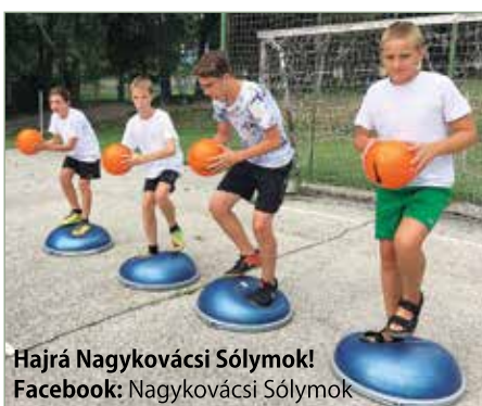
Hajrá Nagykovácsi Sólymok! Facebook: Nagykovácsi Sólymok

Egyik délután kvíz vetélkedőn teheték próbára a tudásukat fociról, kézilabdáról és az éppen aktuális Vizes VB-ről szóló kérdésekben.