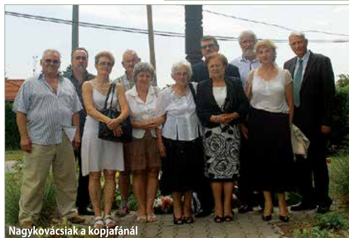
Nagykovácsiak a kopjafánál