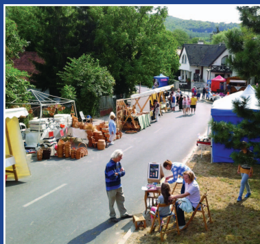
Képek a nagykovácsi búcsúról