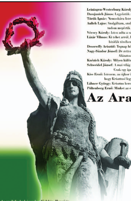
Az aradi Szabadságharcosok fialakja, Hungária