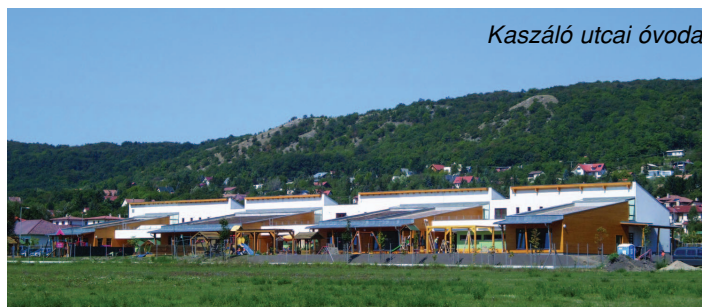
Kaszáló utcai óvoda