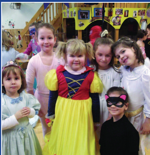
Farsang az iskolában