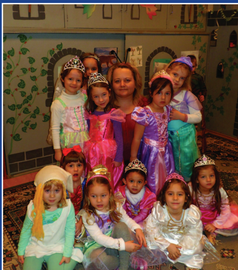
Farsang az óvodában