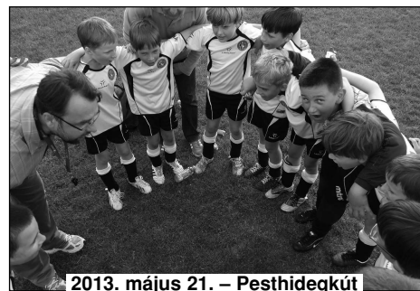
2013. május 21. – Pesthidegkút

Egy hét telt el és belevágtunk egy újabb nagy kalandba. Tökölre utaztunk egy U11-es és egy U9-es, 4-4 csapatos tornára a Csepel-Sziget Focisuli meghívására 2013. június 09-én, vasárnap. Mivel ebben a régióban még nem ismertük az ellenfeleket a házigazdán kívül, nem