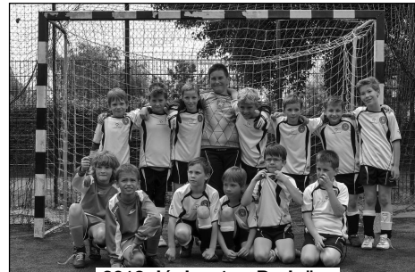
2013. június 1. – Budaörs