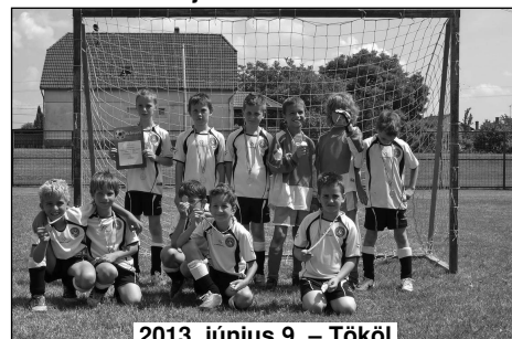
2013. június 9. – Tököl

tudtuk, hogy mire számítsunk, de mindenképpen méltón szerettük volna képviselni az egyesületünket és Nagykovácsit.