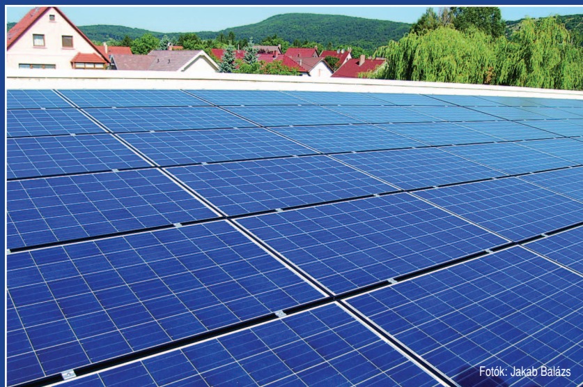
Napelemek az iskolatetőn