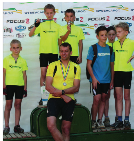
Crosskovácsi csapata az OB-n