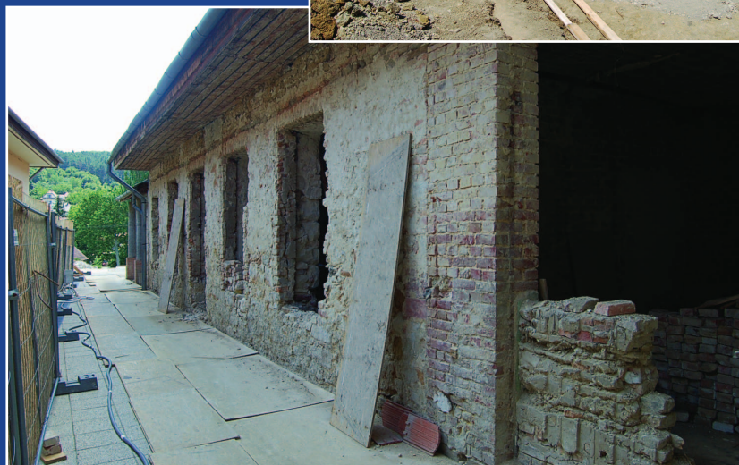
Öregiskola nyugati szárnyának munkálatai