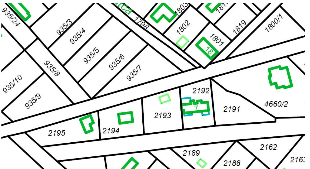
Helyszínrajz 1. Értékesítendő terület 2. 70/2012 döntés 3. korábban értékesített terület