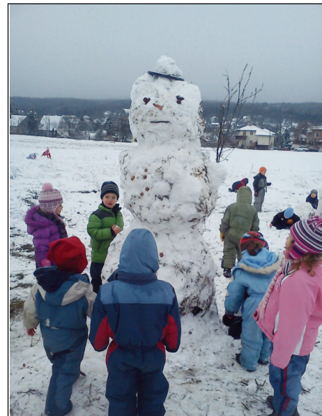
A Barackfa csoport Hóembere