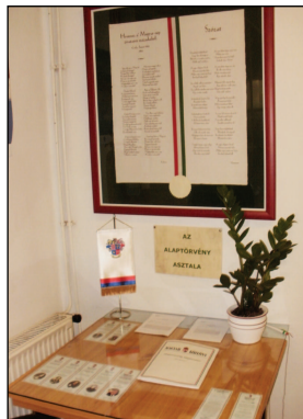
Az Alaptörvény Asztala

Ha Ön az asztalon elhelyezett igénylőlapot kitölti, Kóvér László, a Magyar Országgyűlés elnöke megküldi Önnek a Magyarország Alaptörvénye című kiadvány ingyenes névre szóló példányát. Lehetőség van a Magyarország Alaptörvénye – díszkiadás című album megrendelésére is, melynek ára: 10.000,- Ft +postaköltség: 1.080,- Ft, +ÁFA Az Alaptörvény Asztala a Polgármesteri Hivatalban a titkárság előterében található.